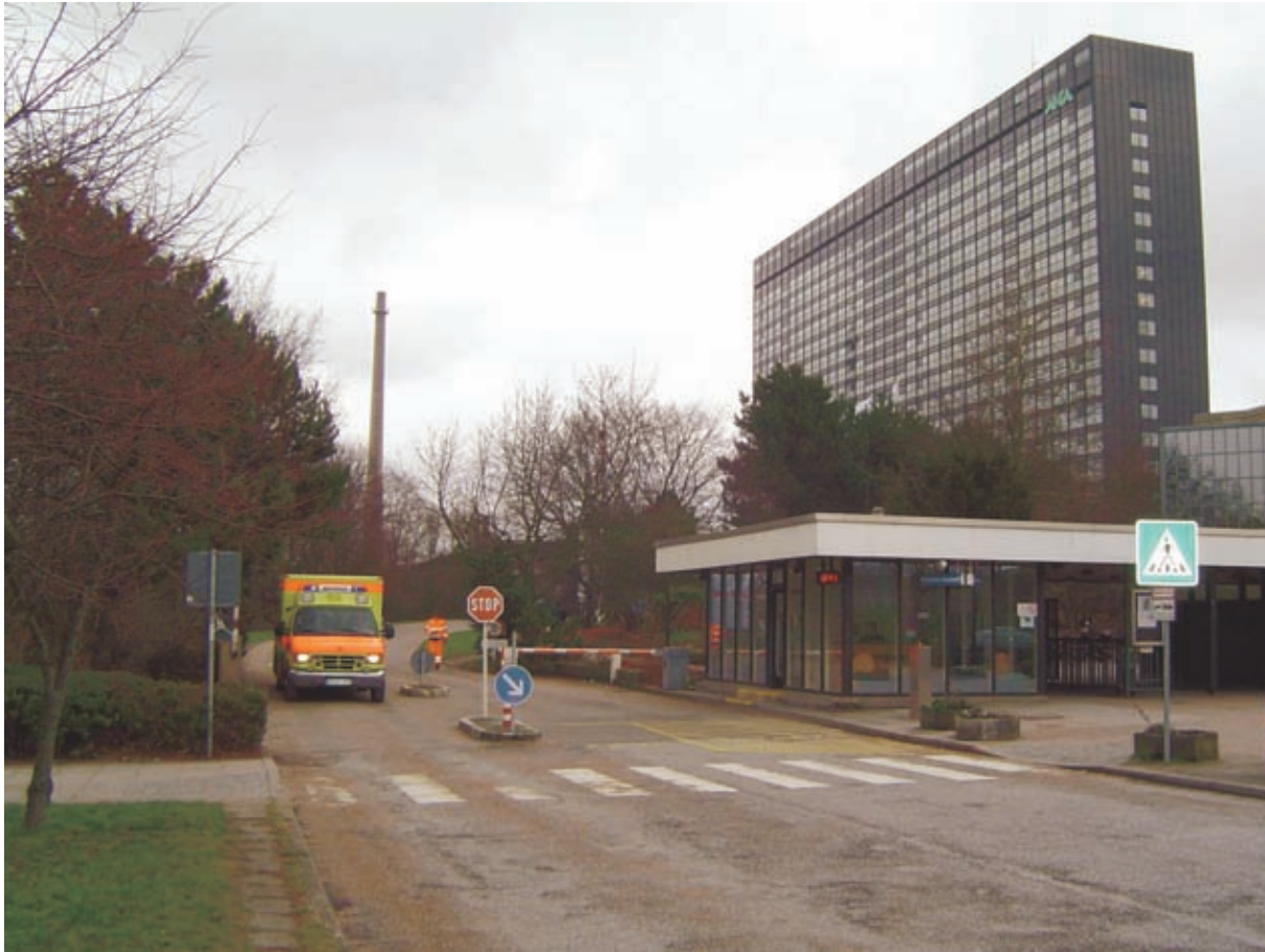
Allgemeines Krankenhaus Altona

Die in Einrichtungen des Gesundheitsdienstes anfallenden Abfallarten sind in Ziffer 2 der „Richtlinie der LAGA über die ordnungsgemäße Entsorgung von Abfällen aus Einrichtungen des Gesundheitsdienstes“ näher beschrieben.