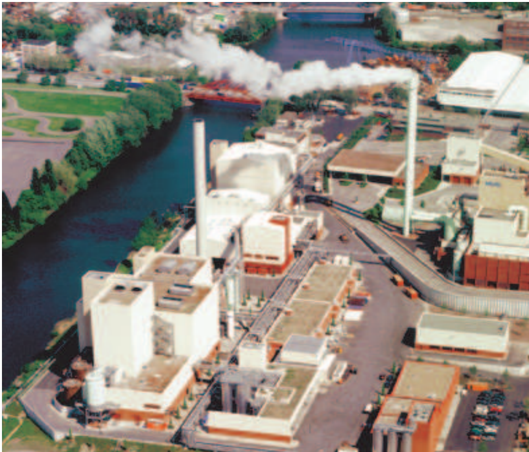
Sonderabfallverbrennungsanlage (vorn links) und Hausmüllverbrennungsanlage (hinten rechts)

Entsorgungskapazitäten in ausreichender Höhe zur Verfügung.