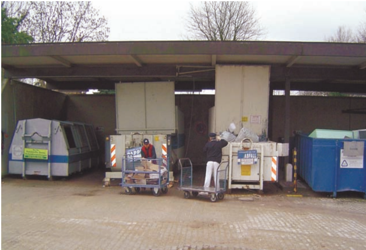
Getrennte Erfassung größerer Abfallmengen

Im Einzelnen werden die Entsorgungswege in den nachfolgenden Kapiteln dargestellt.