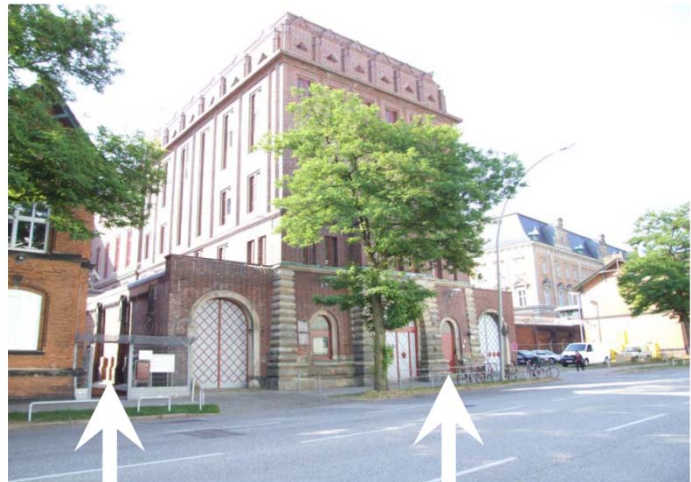
Besuchereingang (für Gefangenenbesuche)

Sie erreichen uns am besten mit öffentlichen Verkehrsmitteln , da im direkten Umfeld kaum Parkplätze zur Verfügung stehen. Auf dem Anstaltsgelände dürfen Sie nicht parken. In unmittelbarer Nähe befinden sich der Fernbahnhof Hamburg-Dammtor sowie der U-Bahnhof Messehallen . Mit dem Bus erreichen Sie die Anstalt über die Haltestelle Sievekingplatz . Mehr dazu finden Sie unter http://www.hvv.de .