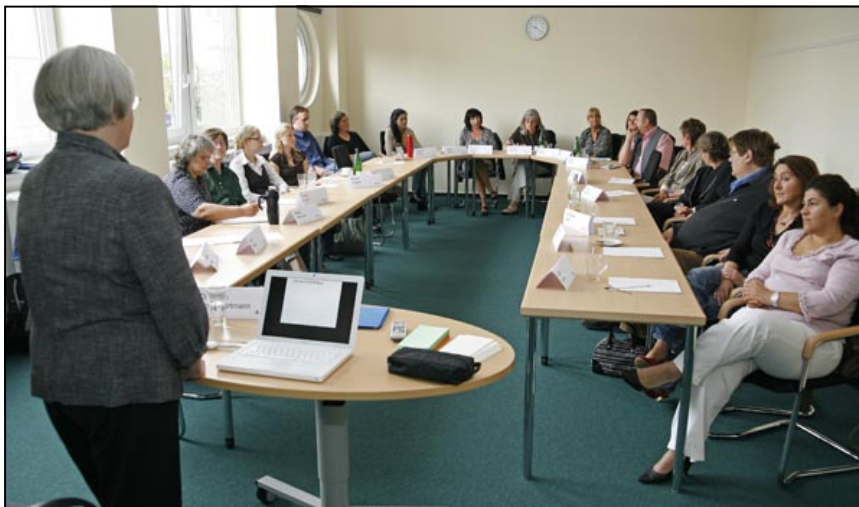
Schulungen kommt im Neuen Haushaltswesen Hamburg eine große Bedeutung zu.

Das Projekt hat auf Basis der Erkenntnisse der Befragung