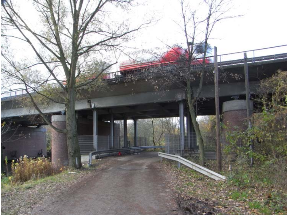
Bild 3: Brücke über den Ernst- August- Kanal und Vogelhüttendeich mit provisorischen statischen Sicherungsmaßnahmen

Aus allen oben genannten Gründen ergibt sich folgerichtig ein Ausbaubedarf der derzeit nur 14,20 m breiten B4/75, um dieses für den Verkehrsablauf im Süden Hamburgs wichtige Streckenelement für heutige und zukünftige Verkehrsaufkommen bedarfsgerecht anbieten zu können.