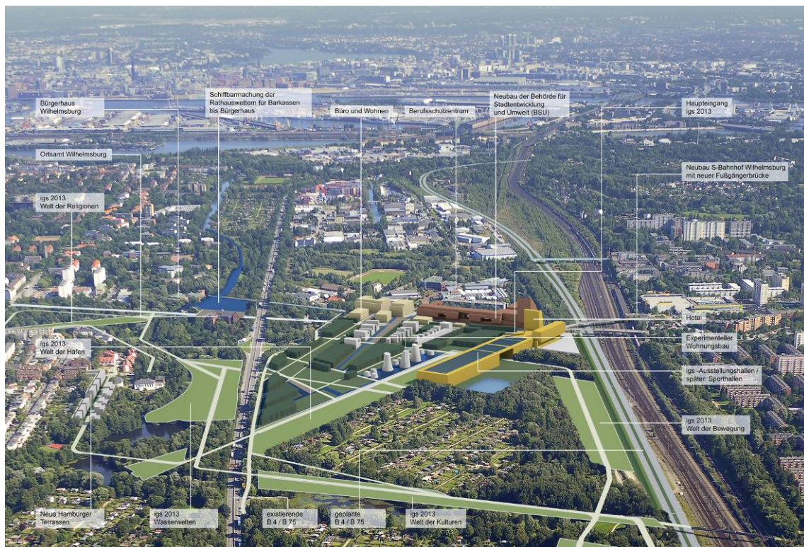
Abb. 1 Luftbildvisualisierung zum Masterplan „Wilhelmsburg Mitte“ (IBA-GmbH 2010)

Aufwertung zentraler Bereiche Wilhelmsburg entspricht dem politischen Leitbild „Hamburg: Wachsen mit Weitsicht“ (Drs. 2009/00944). Integraler Bestandteil dieser übergeordneten Planung ist das Leitprojekt „Sprung über die Elbe“, welches eine qualitätvolle Stadtentwicklung für die Elbinseln zwischen HafenCity und Harburger Binnenhafen anstrebt. Der „Sprung über die Elbe“ stellt das zentrale Projekt der zukünftigen Stadtentwicklung Hamburgs dar. Durch die Bündelung künftiger städtebaulicher Aktivitäten in der geografischen Mitte der Stadt soll ein „Brückenschlag“ zwischen der Hamburger City und dem südlich der Elbe gelegenen Bezirk Harburg gestaltet werden. Der Trittstein im Norden, das neue Stadtquartier HafenCity, ist bereits in Bau. In Wilhelmsburg werden zahlreiche neue Bauprojekte vorbereitet, bestehende Quartiere erneuert sowie innovative Planungsansätze erprobt, die im Rahmen der Internationalen Bauausstellung (IBA) sowie der Internationalen Gartenschau 2013 (igs) einer breiten Öffentlichkeit präsentiert werden sollen. Durch die Verlegung der Wilhelmsburger Reichsstraße wird die wesentliche Grundlage für die Realisierung des Leitprojektes „Sprung über die Elbe“ in Wilhelmsburg geschaffen.