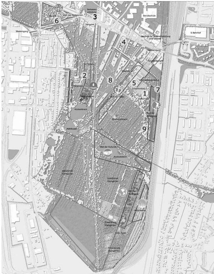
Abb. 2 Luftbildvisualisierung zum Masterplan „Wilhelmsburg Mitte“ (IBA-GmbH 2010)