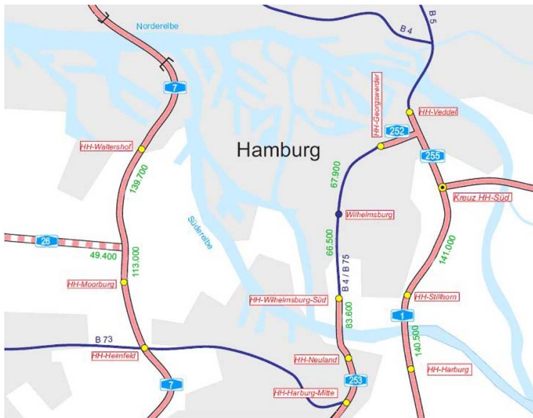
Bild 1: Querschnittsbelastungen 2025 in KFZ/24 h (Vergleichsfall ohne HQS)

streifigen Querschnitt der BAB 1 befahren ca. 141.000 KFZ/24 h. Auf der B 4/75 werden bis zu 68.000 KFZ/24 h erwartet (Bild 1).