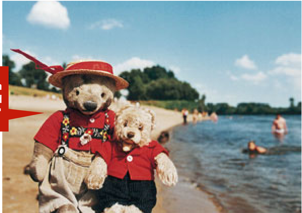
Im Strandbad Finkenriek