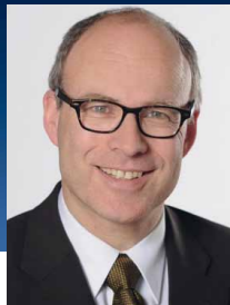
Ties Rabe SENATOR FÜR SCHULE UND BERUFSBILDUNG