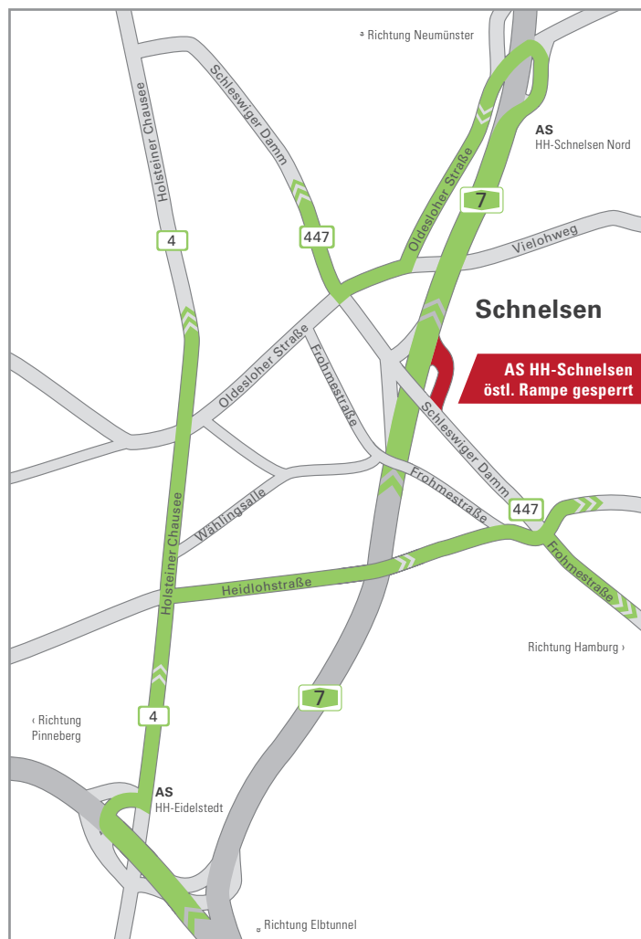
Abb.2: Verkehrsumleitung bei Sperrung der östlichen Ausfahrtsrampe AS HH-Schnelsen

Im Bereich HH-Schnelsen Nord wird für den Abriss bzw. Neubau der Unterführung Oldesloer Straße jeweils ein Fahrstreifen je Fahrtrichtung unterhalb der Brücke gesperrt. Damit der Verkehr auf der Oldesloer Straße fließen kann, werden zeitgleich die Linksabbiegerspuren der Anschlussstelle gesperrt.