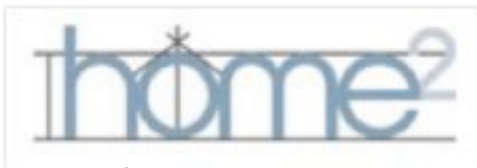
Logo home 2

Die Messe Home 2 bietet vom 27. bis 29. Januar 2017 kompakt und übersichtlich Tipps und Trends rund um energetisches Bauen und Modernisieren sowie Elektro-Mobilität. Auf dem rund 700 m 2 großen Parcours in der Halle A1 der Messe Hamburg können Besucher Elektroautos und -kleintransporter verschiedener Hersteller testen und sich praxisnah über Ladestationen, Speichermöglichkeiten, Anwendungskonzepte und Fördermöglichkeiten informieren.