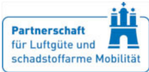
Logo Luftgütepartnerschaft Hamburg

Die Luftgütepartnerschaft stellt gemeinsam mit hySOLUTIONS die Beschaffungsoffensive für Elektrofahrzeuge „e-Drive 2017“ vor. Die Beschaffungsoffensive wird durch eine Projektförderung der Bundesregierung ermöglicht, ist marken- und modellübergreifend angelegt und lässt wesentlich interessantere Konditionen als der im Frühsommer 2016 eingeführte Umweltbonus (Kaufprämie) erwarten. Mehr dazu finden Sie auf den Seiten der Luftgütepartnerschaft.