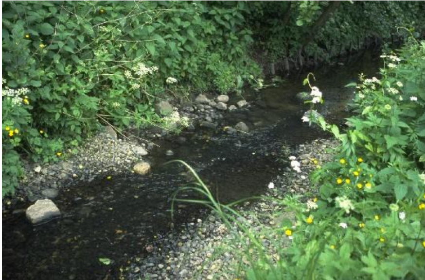
Foto 5. Perfil bajo y medio de un área de elevación reestablecida tomado en el mismo sitio que la foto 2.

Un gran desnivel (Foto 6a) fue sustituido por una rampa áspera (Foto 6b) en la zona 1 del proyecto.