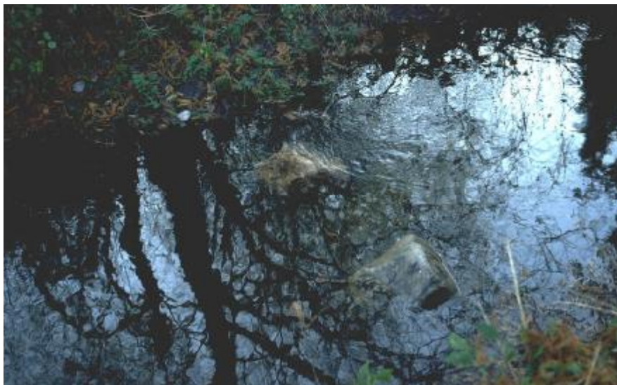
Foto 4. Rocas de obstrucción generan turbulencia (izquierda: plano, reflejo).