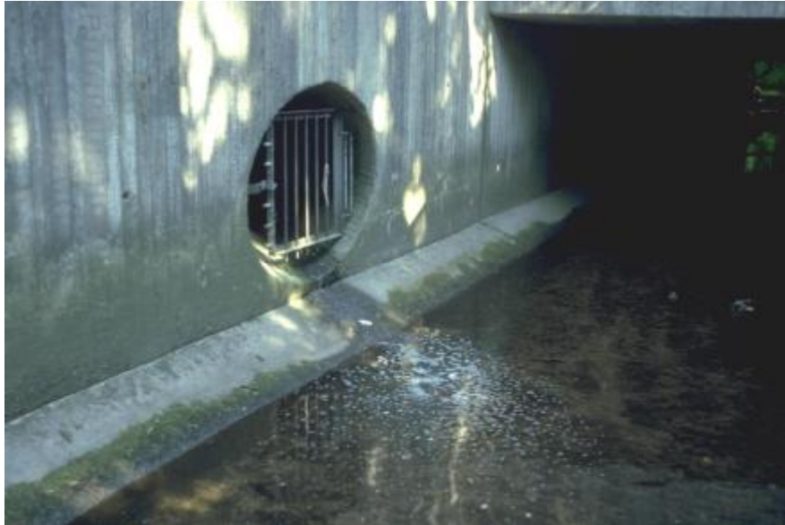
Foto 8. El agua de limpieza tiene, en situaciones de agua baja, una afectación directa. El diámetro de la descarga permite imaginar el impacto durante fuerte lluvia.

Con relación a los primeros tres temas antes mencionados, se requiere de una intensa campaña de información a la población y si es necesario el uso de restricciones de tipo administrativo. Existen buenas experiencias en lo que se refiere a la asesoría ambiental con publicaciones en la prensa, actividades informativas y envíos por correo.