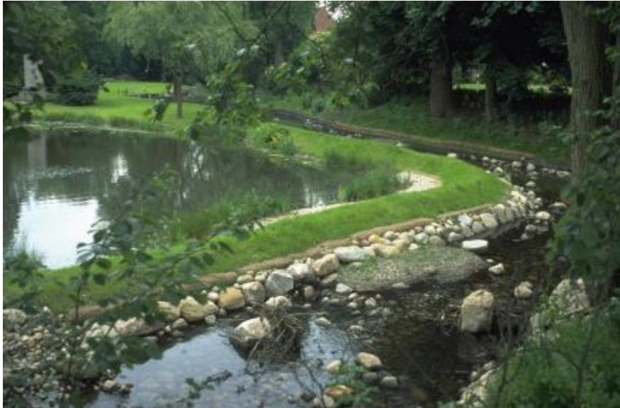
Foto 7. El estanque, ahora separado del Wandse, cuenta con una conexión lateral.