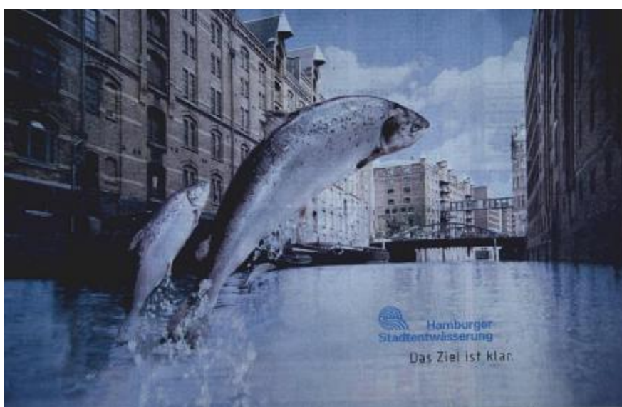
Foto 9. La publicidad de la empresa Hamburger Stadtentwässerung dice “La meta está clara”.

Con relación a la cuenca del Elbe y las directrices marco europeas, aparece la duda acerca de la factibilidad del libre movimiento de los organismos entre los ríos Wandse, Alster y Elbe. Esto considerando las estructuras de protección de crecidas que harían esta conexión ni fácil ni barata de realizar. Al respecto existe una interesante tesis de licenciatura que incluye los aspectos técnicos y de ingeniería. Después de su realización podrá hablarse de un sistema sano de ríos en la gran ciudad de Hamburgo, dentro del cual los peces podrán viajar en una larga zona desde el área de la desembocadura del Elbe y del mar nuevamente aguas arriba al área de desove y cría en la cuenca del Wandse.