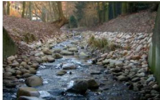
Foto 6 a y b. Desnivel en Amtsstraße, Rahlstedt, antes y después de la instalación de la rampa áspera.

Además de las diversas actividades de los padrinos de arroyo, la administración ha realizado algunos trabajos específicos. Hasta ahora se ha separado del arroyo uno de los estanques (Foto 7, poco después de la conclusión del trabajo). Esto no solo tiene las consecuencias ecológicas esperadas para el arroyo sino que además, por ejemplo, en invierno se puede patinar sin peligro en los estanques, ya que el estanque se encuentra unido a la corriente del arroyo a través de un canal lateral.