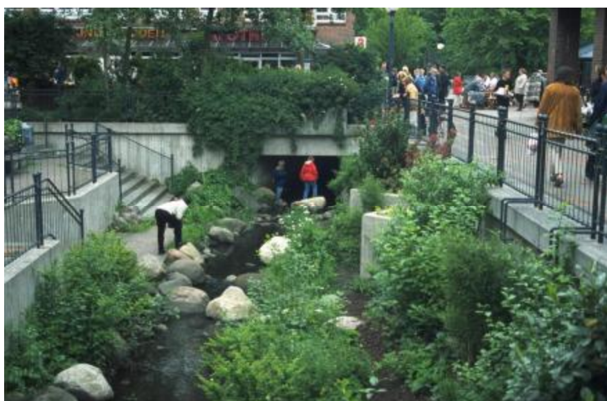
Foto 1. Arroyos de la ciudad alrededor de los cuales se ha construido de forma extrema. Estos pueden resultar interesantes para la gente; aquí, en la zona del centro comercial de Rahlstedt.

La importancia de las corrientes de agua en las ciudades como espacio vital y áreas de esparcimiento y descanso está siendo recuperada cada vez en mayor medida (Foto 1). Ciudadanas y ciudadanos entusiastas encuentran, por ejemplo, en los “Bachpatenschaften” (“apadrina un arroyo”) un interesante campo de acción. Mediante la implementación de proyectos interactivos es posible lograr una mayor identificación de la población con el área donde vive generando un ambiente más familiar. Con el fin de apoyar técnicamente a estos grupos altruistas, la Administración de Wandsbek ofrece asesoría en cooperación con asociaciones ambientalistas (entre otras).