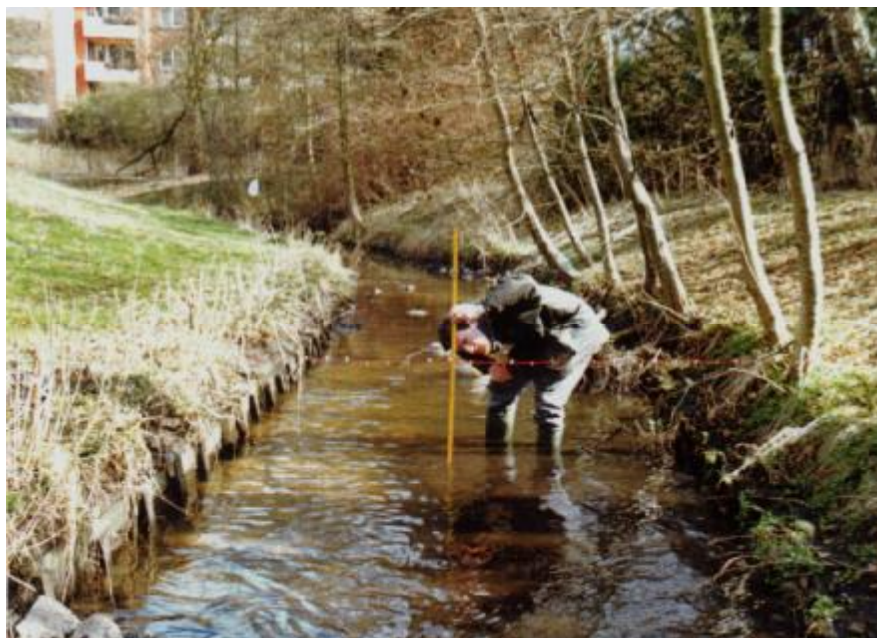
Foto 2. Zona de nivel de agua baja y media de un arroyo demasiado amplio y poco natural con un lecho de arena y lodos atípicos de la región.

Estos estanques causan adicionalmente el incremento de la temperatura que trae junto consigo los típicos problemas de aguas eutróficas e hipertróficas, posibles decrementos en las concentraciones de oxígeno, fluctuaciones extremas del pH, y hasta concentraciones de nitratos en el rango crónico tóxico para el desarrollo de larvas de organismos sensibles.