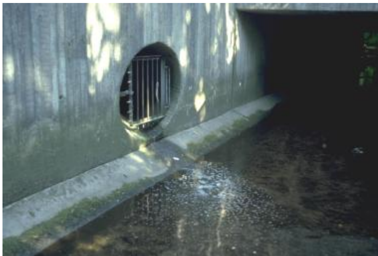
Figure 8 : L'évacuation a des incidences néfastes immédiates dans l'environnement surtout dans les faibles profondeurs. Le diamètre de la canalisation laisse deviner la situation hydraulique lors de fortes pluies.

Nécessairement aux trois premiers thèmes, les informations transmises à la population sont couplées le cas échéant avec une décision réglementaire. Grâce à l'expérience du conseil environnemental, des communiqués de presse, des manifestations et des courriers publicitaires sont disponibles.