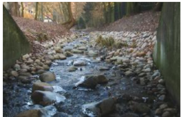
Figure 6a et b : Remplacement d'une chute par une rampe rocailleuse à Rahlstedt (zone publique)