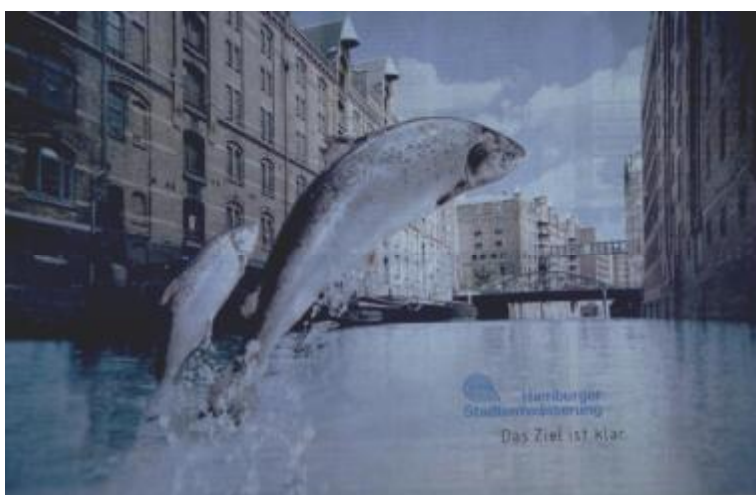
Figure 9 : La publicité de l'assainissement d'Hamburg dit « l'objectif est clair ».

Ce n'est qu'après la réalisation du projet qu'on pourra toutefois parler de fleuve sain dans la ville de Hambourg, dans laquelle des randonneurs peuvent de nouveau parcourir de longues distances au niveau de l'embouchure de l'Elbe et de la mer, découvrir les frayères et leur lieu de croissance dans la zone attenante à Wandse.