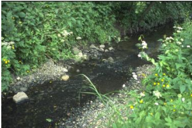
Figure 5 : Les remous stimulent la structure du canal, (même vue que figure n°2)