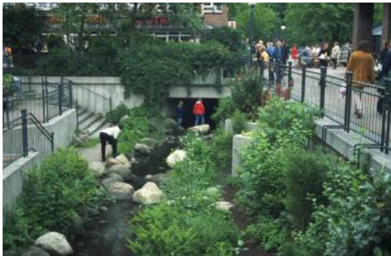
Figure 1 : Même en ville dans un environnement très aménagé les ruisseaux peuvent susciter l’intérêt des habitants-comme ici près de la zone commerciale de Rahlstedt.

De plus en plus de villes redécouvrent la signification du cours d’eau comme écosystème et zone de détente et de loisirs en lien avec à la nature (figure 1). Des citoyens et citoyennes engagés trouvent par exemple des domaines d'activités intéressants au sein des «parrainages de ruisseaux» («Bachpatenschaften»). Par la réalisation de ces plans d’actions les citoyens se rapprochent de leur environnement et s’en sentent plus concernés. Grâce à son encadrement et son travail en collaboration avec les associations de protection de la nature le district apporte à ces néophytes l’aide technique nécessaire.