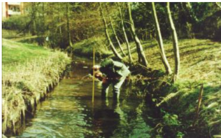
Figure 2 : Le ruisseau dont le cours a été étendu, dénaturé par des aménagements repose désormais sur un lit atypique de boues ou de sable

Les données existantes montrent que le niveau de température et la composition chimique de l'eau ne posent pas de problèmes insurmontables à l'atteinte des objectifs de développement. Les principaux problèmes de Wandse sont en effet la structure monotone du cours d'eau (figure 2) ainsi que la présence d'étangs dans les parcs qui perturbent la continuité du courant. En plus de l'augmentation de la température, ces étangs conduisent à des problèmes d'eutrophie, voire d'hypertrophie des cours d'eau. Les baisses importantes de la concentration en oxygène, les variations extrêmes de pH jusqu'à la présence de nitrate contribuent à une toxicité chronique affectant les organismes sensibles durant leur développement larvaire. Deux tests réalisés durant les printemps 1999 et 2000 ont permis d'évaluer le potentiel de réintroduction de la truite à l'aide de boîtes Vibert dans les eaux de Wandse. Ceux-ci ont été conduits par un groupe de jeunes, adhérents de l'association nationale de pêche sportive.