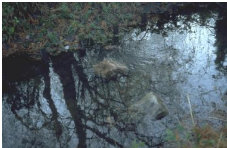
Figure 4 : L'introduction de pierres au sein du cours d'eau assure la turbulence (gauche : plat, reflet)

Une chute élevée (figure 6a) a été remplacée par une rampe rocailleuse (figure 6b) dans la zone 1 du projet.