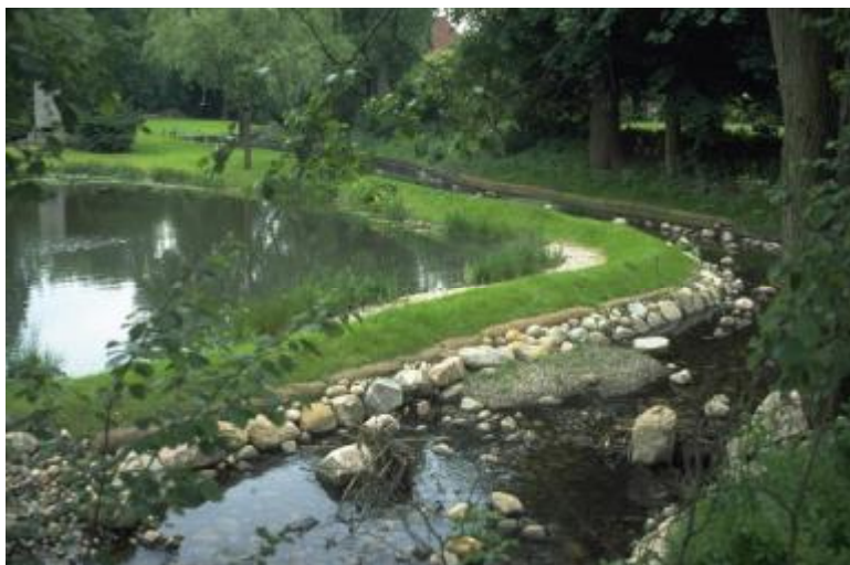
Figure 7: Etang de Liliencron désormais séparé et juxtaposé au Wandse