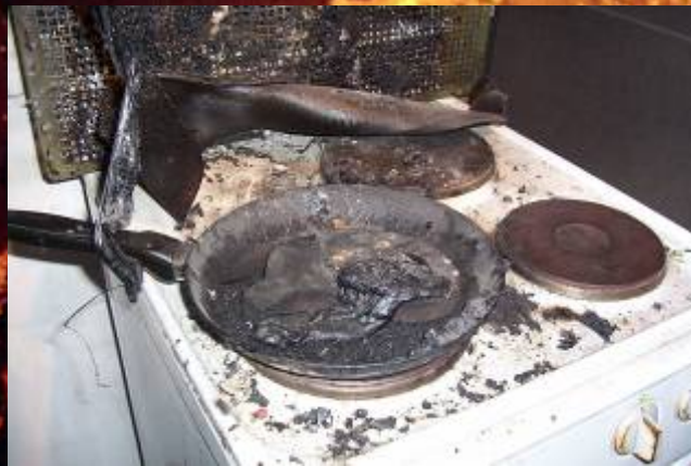
Brandexponate im Rauchraum