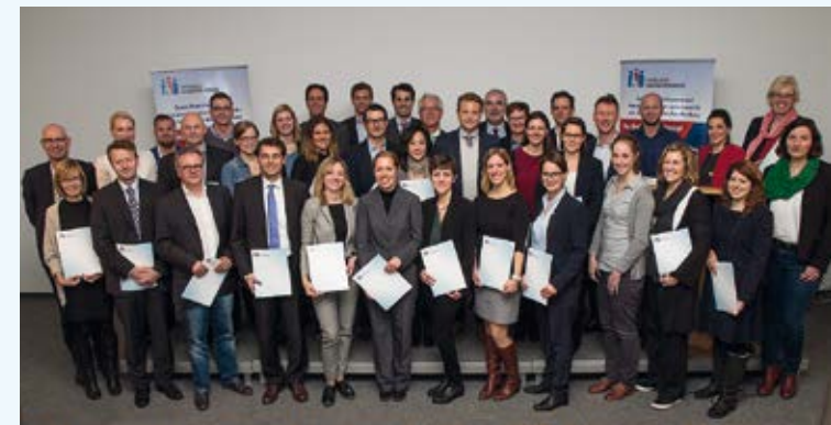
Die Vertreter der neu ausgezeichneten Unternehmen nach der Urkundenverleihung im Museum der Arbeit