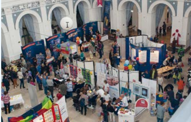
Infomesse auf dem Familientag in der Handelskammer