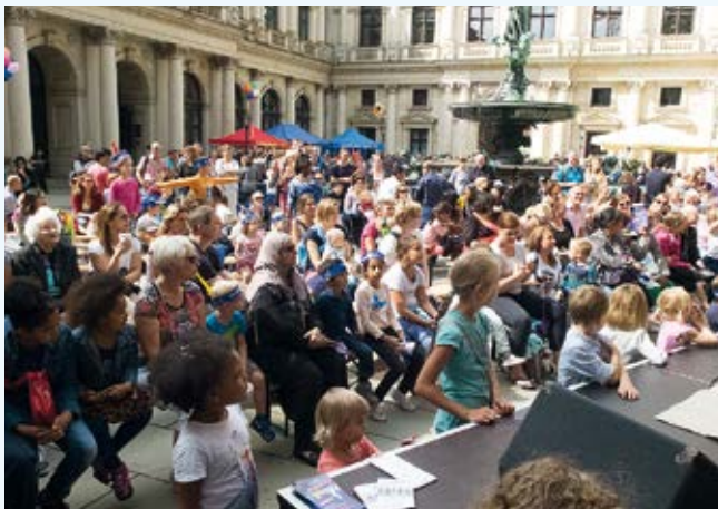
Familientag-Besucher im Innenhof des Hamburger Rathauses