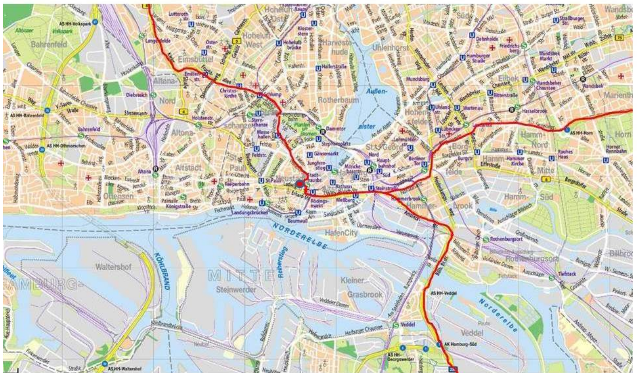
A7 v. Norden