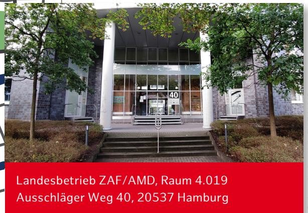
Landesbetrieb ZAF/AMD, Raum 4.019 Ausschläger Weg 40, 20537 Hamburg