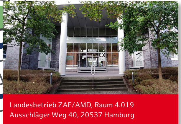
Landesbetrieb ZAF/AMD, Raum 4.019 Ausschläger Weg 40, 20537 Hamburg