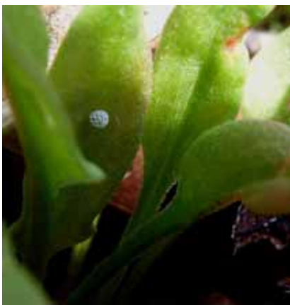
Ei des Braunen Feuerfalters

Tagfalter, Dickkopffalter und Widderchen gehören zu den bekanntesten und beliebtesten Insekten. Ihre Biologie und Ökologie ist relativ genau erforscht - eine entscheidende Voraussetzung für einen wirkungsvollen Schutz. Wesentliche Grundlage aller Schutzbemühungen bildet nach wie vor die Rote Liste. Sie muss daher in regelmäßigen Abständen auf den neuesten Wissensstand gebracht werden. Dies gilt umso mehr, als Schmetterlinge bei der Bewertung von Biotopen in der Landschaftsplanung und bei der Beurteilung des Erfolgs von Naturschutzmaßnahmen eine wichtige Rolle spielen. Als an ganz spezifische Habitatsigenschaften und -strukturen angepasste Organismen, die zudem auf Veränderungen schnell reagieren, sind viele Arten sehr gute Indikatoren für die Entwicklung der Biodiversität eines zu untersuchenden Gebietes.