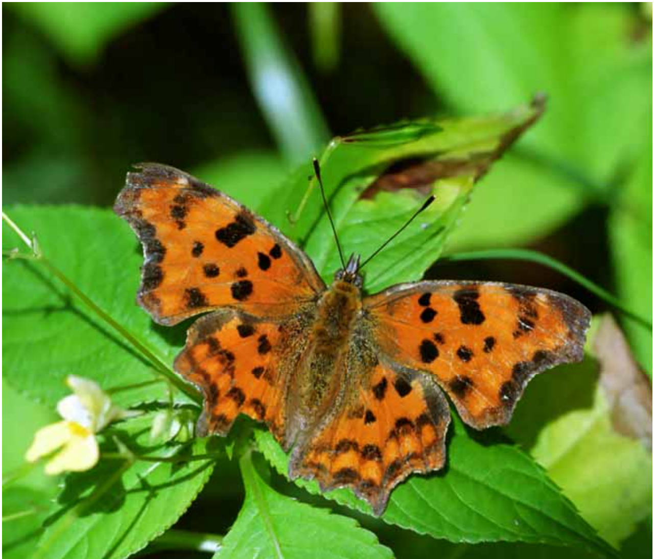
Nymphalis c-album (C-Falter)