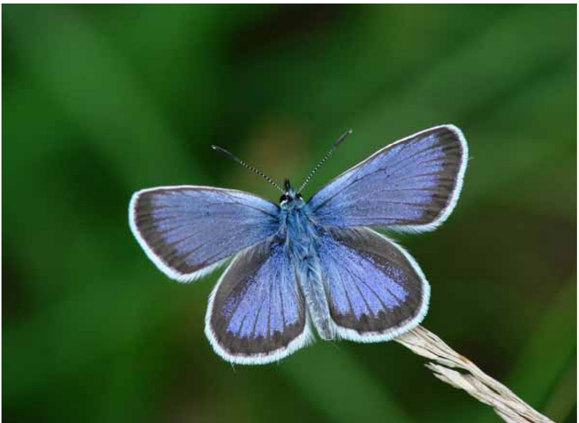
Plebeius argus (Geißklee - Bläuling)