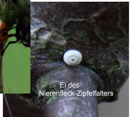
Ei des Nierenfleck-Zipfelfalters