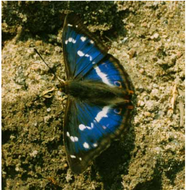
Apatura iris (Großer Schillerfalter)

Der Abteilung Naturschutz in der BSU, insbesondere G. Schäfers und S. Voß, danke ich für die organisatorische Unterstützung. Auch zwei von der Umweltstiftung der H.E.W. und der N.U.E.-Stiftung / Bingo-Lotto geförderte Projekte, die sich u.a. mit der Ökologie und Bestimmung von Tagfaltern beschäftigten, unterstützen die Arbeit an der Roten Liste. Die Naturwacht Hamburg trug laufende anfallende Sachkosten.