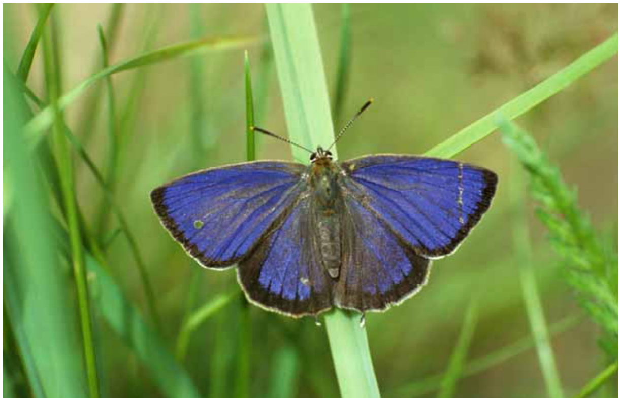
Neozephyrus quercus (Blauer Eichenzipfelfalter)