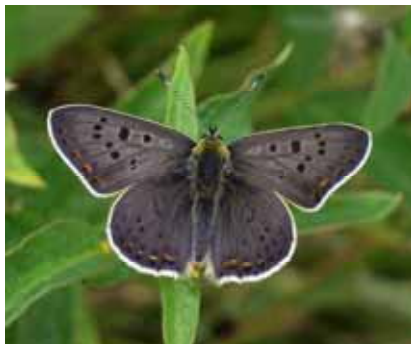
Lycaena tityrus (Brauner Feuerfalter)