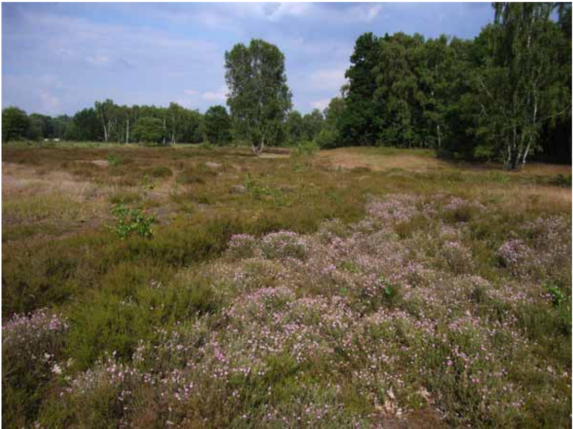
Boberger Niederung: Lebensraum des Geißklee-Bläuling)