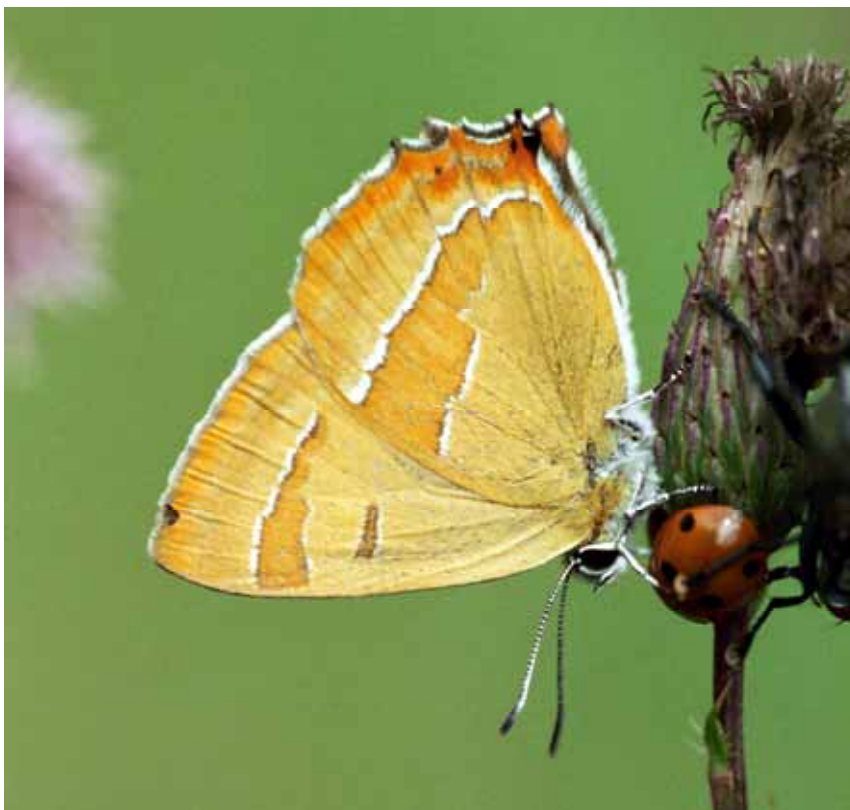
Thecla betulae (Nierenfleck-Zipfelfalter)