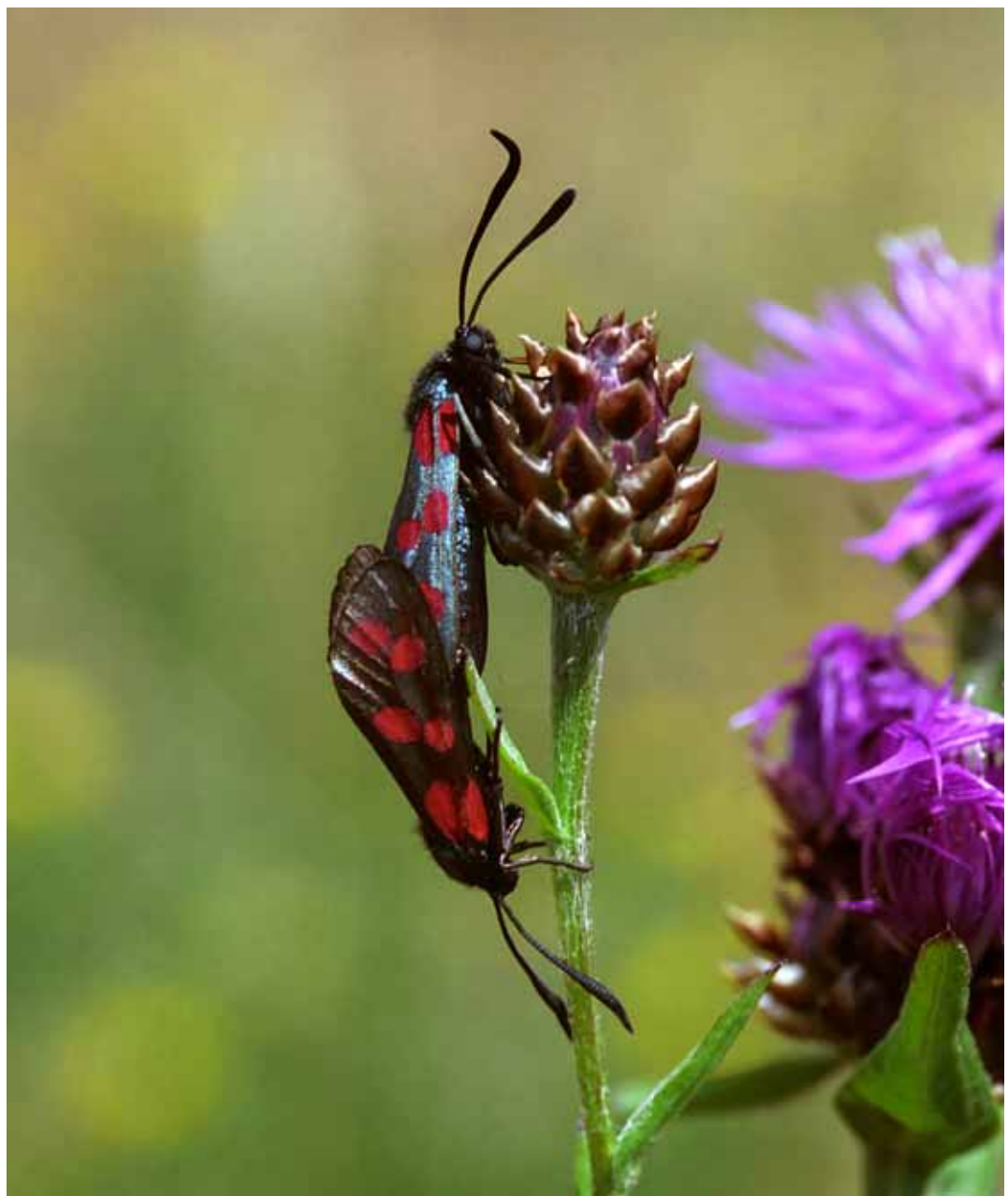
Zygaena filipendulae ( Sechsfleck-Widderchen), Kopula