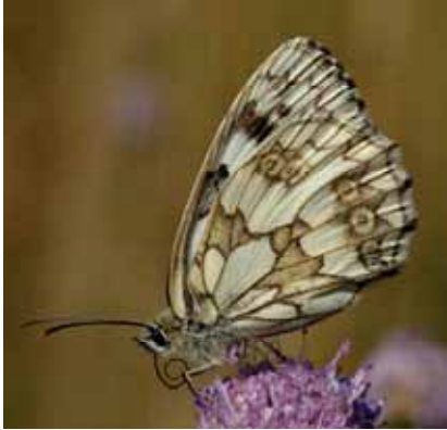
Melanargia galathea (Schachbrettfalter)