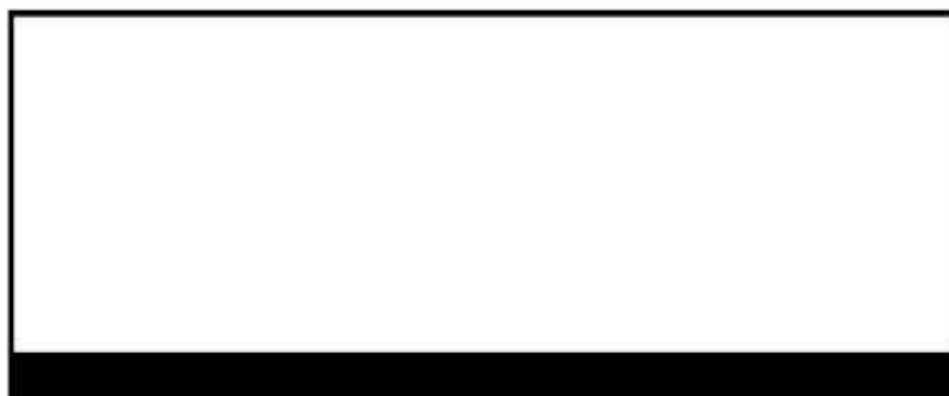
Unterschrift des Antragstellenden

Hinweis: Der Landesbetrieb Verkehr ist nach dem Straßenverkehrsgesetz und den hierzu erlassenen ausführlichen Rechtsverordnungen verpflichtet, Ihre oben angegebenen persönlichen Daten zu speichern. Weitere Informationen erhalten Sie hierzu an den Infopoints des Landesbetrieb Verkehr, auf der Website www.hamburg.de/lbv oder auf Nachfrage direkt beim Landesbetrieb Verkehr.