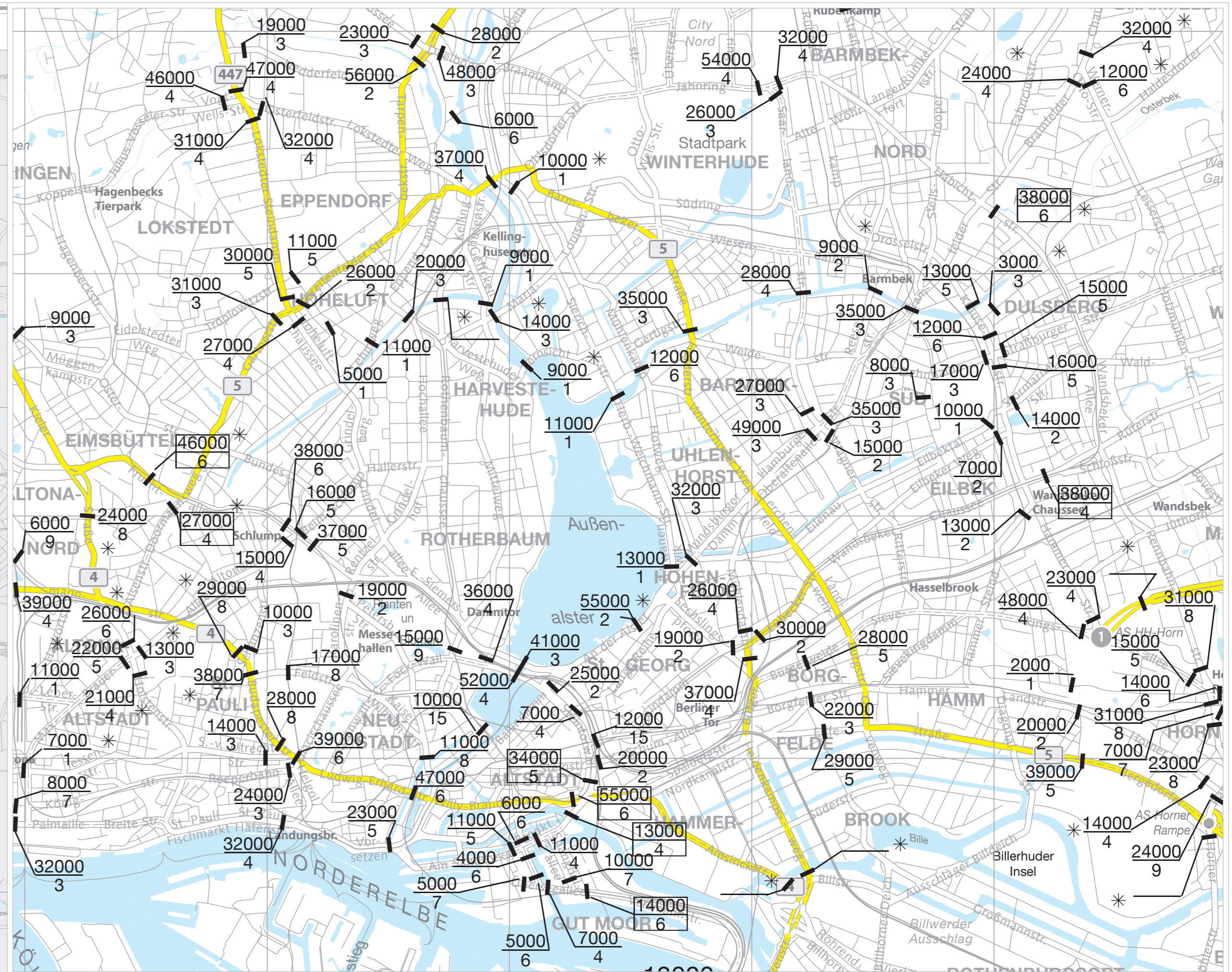
SONDERPLAN INNERE STADT 1: 30 000

Freie und Hansestadt Hamburg Behörde für Verkehr und Mobilitätswende DURCHSCHNITTLICHE TÄGLICHE KFZ-VERKEHRSSTÄRKEN AN WERKTAGEN (Montag - Freitag)