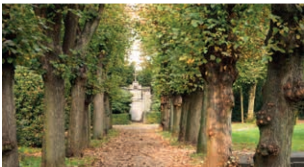
Der Wohlers Park wurde bis 1979 als Friedhof genutzt, heute steht die Freizeitnutzung im Vordergrund