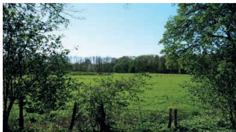
Helmuth-Schack-See mit angrenzendem Landschaftsschutzgebiet „Osdorfer Feldmark“