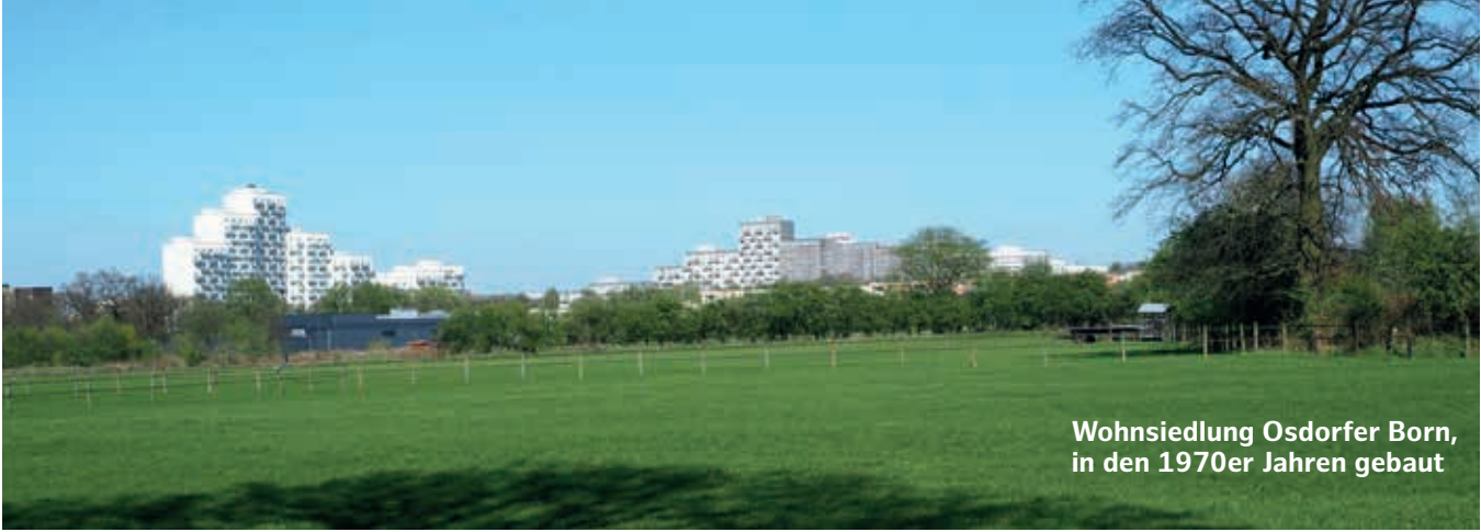
Wohnsiedlung Osdorfer Born, in den 1970er Jahren gebaut