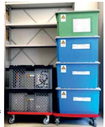
Die sechs Notfallboxen des Staatsarchivs auf ihren Rollwägen