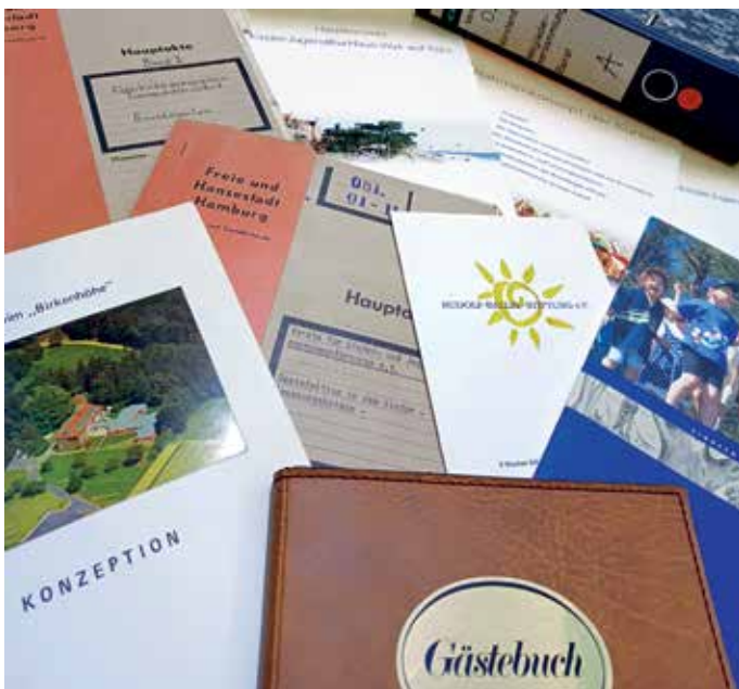
Neuzugänge im Magazin: Vereinsunterlagen der Ballin-Stiftung