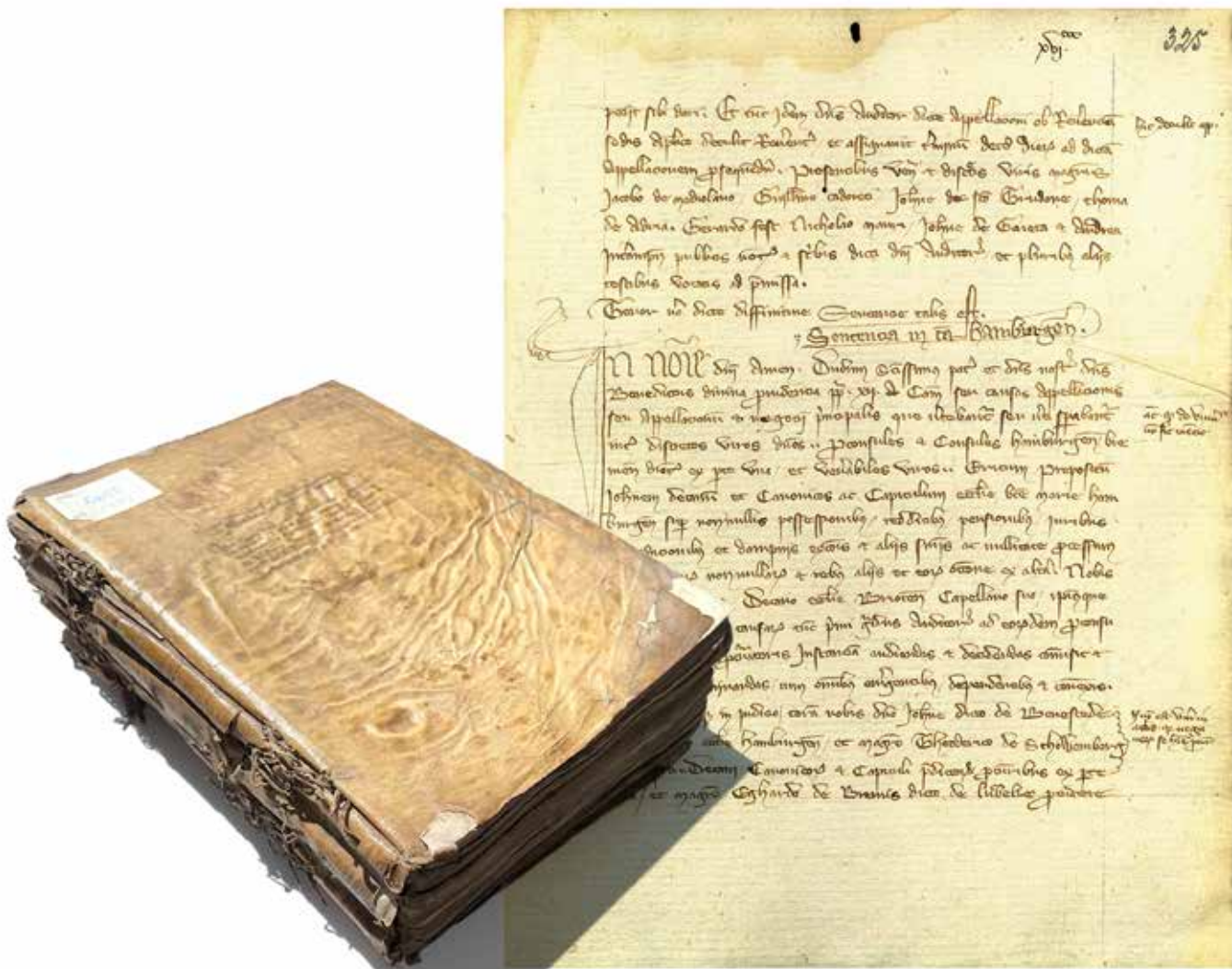
Endurteil im Prozess erster Instanz vor dem päpstlichen Auditor Alanus de Gars, 1340