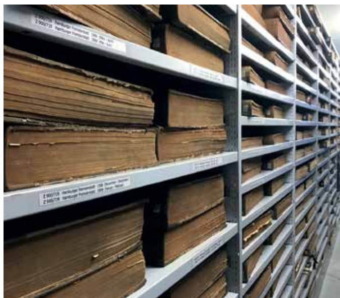
Hamburger Fremdenblatt im Original

Bevor die Bände zur Digitalisierung an die Dienstleister gingen, erfolgten mehrere umfangreiche Sichtungen der Bestände. Hier wurde auch ein besonderes Augenmerk auf den Erhaltungszustand der Zeitungsbände gelegt. Bände, die sich in einem desolaten Zustand befanden und bereits stark geschädigt waren, wurden nicht an einen externen Dienstleister gegeben, sondern über die Medienwerkstatt der SUB digitalisiert.