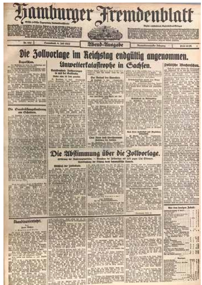
Hamburger Fremdenblatt vom 9. Juli 1927