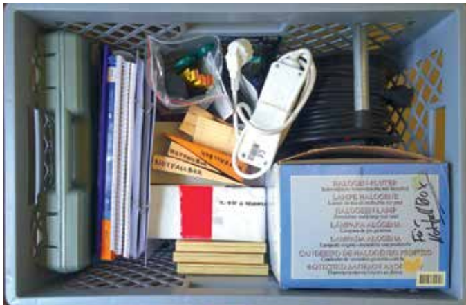
Notfallbox für Dokumentation und Arbeitsplatz

Die Notfallboxen des Staatsarchivs sind thematisch gegliedert. Es gibt zwei unterschiedliche Arten von Boxen: Die beiden Boxen für Arbeitsschutz und Dokumentation/Arbeitsplatz sind Gitterboxen, die geleert auch für den Transport von nassem Archivgut verwendet werden können. Durch den durchbrochenen Boden und die Wände kann Wasser gut ablaufen. Die restlichen vier Boxen sind geschlossene Kunststoffboxen.