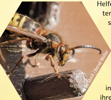
(europäische) Hornisse Vespa crabro

Hornissen gehören seit 1987 zu den besonders geschützten Tierarten und stehen auf der „Roten Liste“ als gefährdete Art. Sie sind nicht nur hervorragende Flugkünstler und haben eine großartige Staatenorganisation, sondern sie sorgen auch durch das Vertilgen großer Mengen von Insekten für Gleichgewicht im Naturhaushalt. Der wichtigste Beitrag zum Schutz der Hornissen ist, dass man ihre Existenz akzeptiert und sie nicht aus Furcht verfolgt und vernichtet.