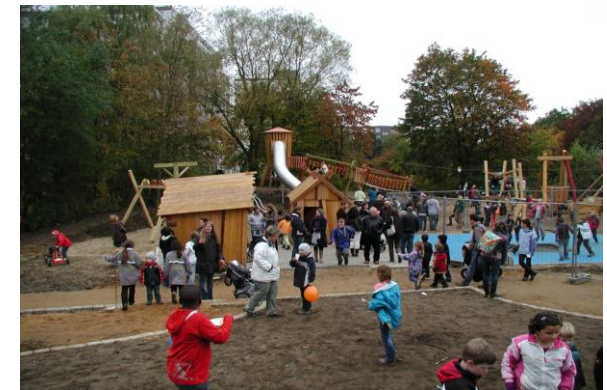
„Ein Platz für Jung und Alt“