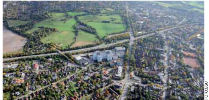
2014 kann der sechsstreifige Ausbau der A7 in Schnelsen starten

Der Planfeststellungsbeschluss wurde am 18.01.2013 im hamburgischen Amtlichen Anzeiger und am 21.01.2013 im schleswig-holsteinischen Amtsblatt veröffentlicht. Die öffentliche Auslegung fand vom 28.01. bis zum 11.02.2013 im Bezirksamt