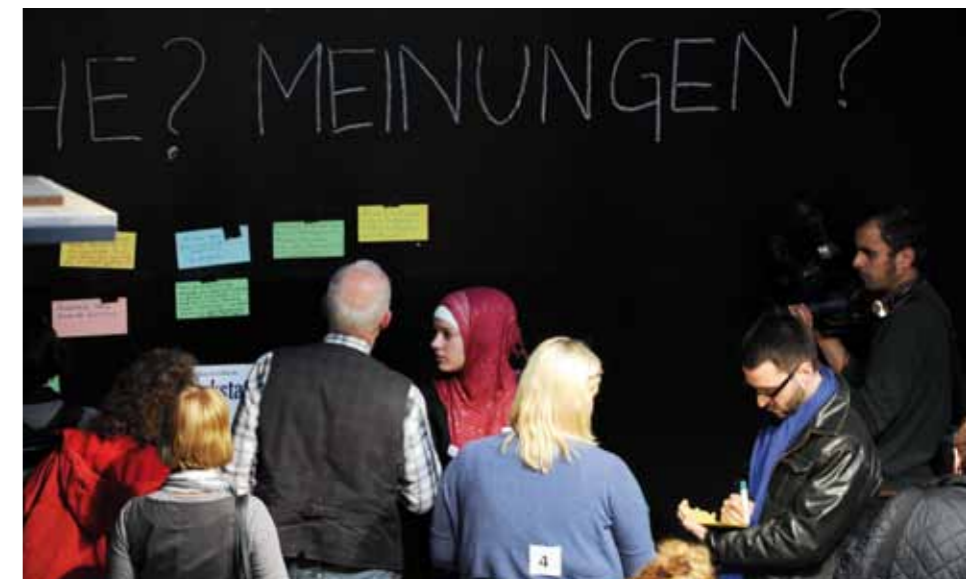
Stimmen von Bürgerinnen und Bürgern

Auf einer Stellwand im Kampnagel-Foyer hatten die Bürgerinnen und Bürger die Gelegenheit Wünsche, Anregungen und Kritik zu äußern. Die Themen waren so bunt wie die Zettel: von Vorfahrtstraßen für Radfahrer auf Hauptverkehrsachsen über Auslaufflächen für Hunde bis hin zum Ausbau der Infrastruktur in Wilhelmsburg und Veddel. Ein großes Thema war die Verdichtung der Stadt: Befürworter schrieben, dass Hamburg im Ausland als Gartenstadt belächelt werde, Gegner fürchteten die totale Verplanung von Grünfreiflächen, forderten statt „Coffee 2 go“ mehr „Car 2 go“. Längere Mietpreisbindung für soziale Wohnungen, überhaupt mehr Wohnungen für Familien statt für Singles, mehr Achtsamkeit bei der Vergabe von städtischen Grundstücken an private Investoren und mehr ‚Makerhood‘ – Arbeiten, Produzieren und Leben in Hamburgs Stadtteilen mehr mischen! – waren nur einige der Anregungen. Andere verlangten einen noch intensiveren Dialog und hofften, dass die Stadtwerkstatt eine ergebnisoffene Bürgerbeteiligung ermöglicht.