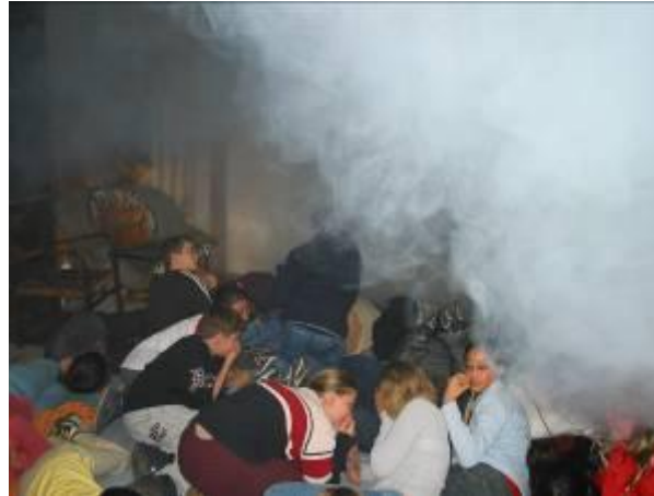
Diese Schüler trainieren im Feuerwehr – Informations - Zentrum das Verhalten im Brandfall

Rauch steigt zuerst nach oben. Bringen Sie ihre Rauchmelder immer unter der Decke an. Machen Sie für den Notfall einen Treffpunkt ab. Legen Sie Fluchtwege für den Notfall fest.