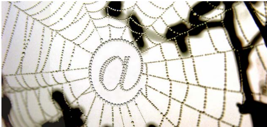
Material 1: Das Netz, in dem wir alle hängen

Ihr Kommentar sollte etwa 800 Wörter umfassen.