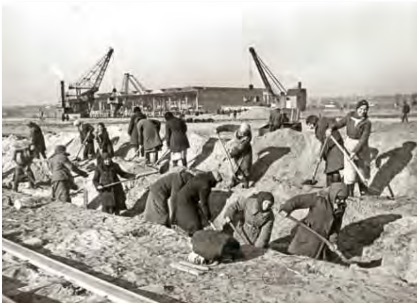
M2 Sowjetische Zwangsarbeiterinnen bei Erdarbeiten am Distelkai, 1943