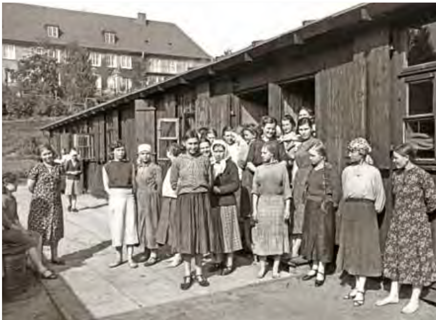
M1 Sowjetische Zwangsarbeiterinnen vor ihrer Baracke, 1942

Die deutsche Bevölkerung hielt in der Regel den geforderten Abstand zu den ausländischen Zwangsarbeitkräften. Für diese bedeutete schon ein Lächeln oder ein aus Mitleid zugestecktes Butterbrot wertvolle Unterstützung.