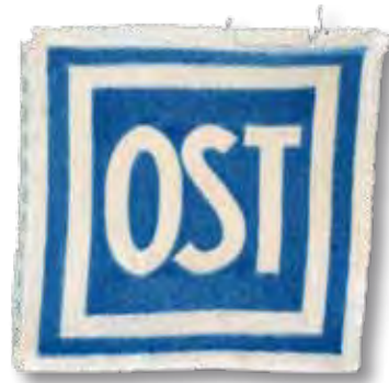
M3 Kennzeichen für Zwangsarbeitskräfte aus der Sowjetunion