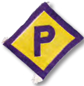
M2 Kennzeichen für polnische Zwangsarbeitskräfte

umzäunten Lagern untergebracht und mussten Kennzeichen tragen, die sie auf den ersten Blick als Angehörige einer im Sinne der NS-Ideologie »minderwertigen« Rasse kenntlich machten. Auf Regelverstöße standen harte Strafen: Verhaftung durch die Gestapo, vorübergehende Einweisung in ein Arbeitserziehungslager oder Überstellung in ein Konzentrationslager. Selbst bei geringfügigen Vergehen oder Sabotageverdacht konnte die Todesstrafe verhängt werden.