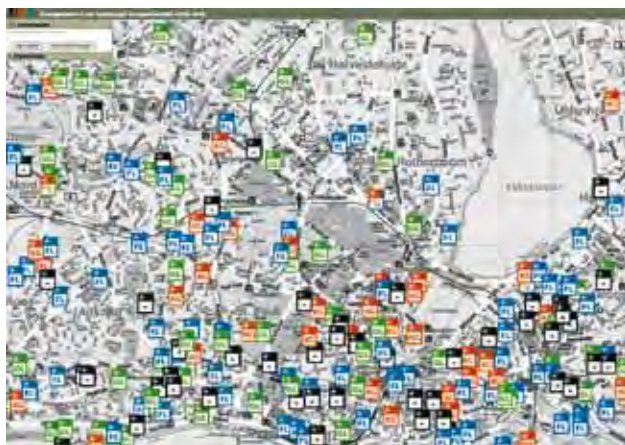
M2 Interaktive Karte »Zwangsarbeit in der Hamburger Kriegswirtschaft 1939–1945«