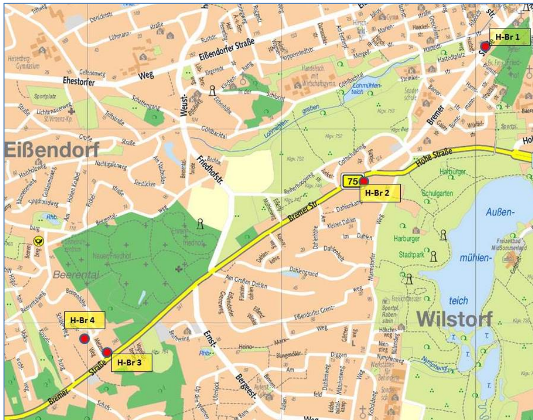
Abbildung 1: Übersichtskarte Bremer Straße mit eingezeichneten Messpunkten

In der folgenden Karte ist die Lage der vier Messpunkte im Verlauf der Bremer Straße dargestellt. Umgebungskarten mit Fotos der Probenahmeorte finden sich auf der nächsten Seite.