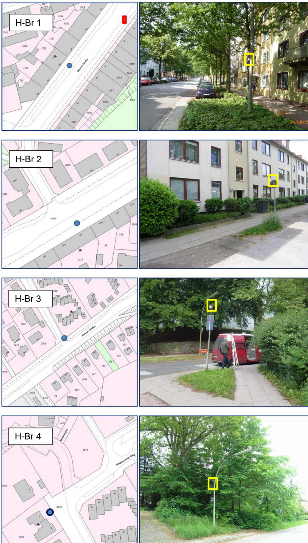
Abbildung 2: Lageplan und Umgebungsansichten der Messorte in der Bremer Straße □ Messort für die Passivsammler ■ Ehemaliger Messort HaLm-Container (Zeitraum 1996/97)