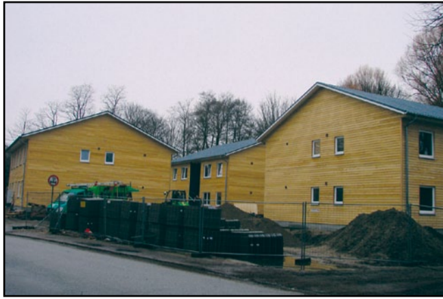
In der Stargarder Straße entsteht die neue Erstversorgung 14, die in drei Holzhäusern ab Dezember 48 Plätze für unbegleitete minderjährige Flüchtlinge bieten wird.