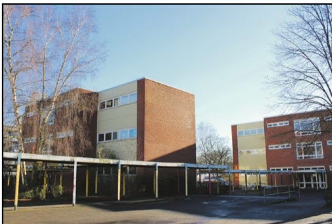
Im August wurde die ehemalige Schule in der Billwerder Straße mit 60 Plätzen in Betrieb genommen. Nach dem umfangreichen Umbau können hier ab Januar rund 200 Betreute leben.