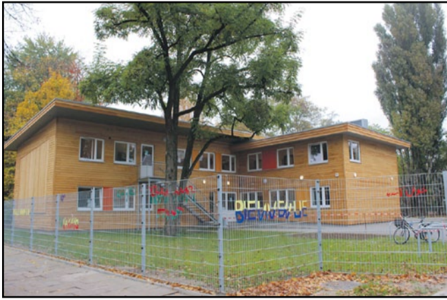
Die Erstversorgung 10 im Lerchenfeld wurde im Herbst eröffnet. Das ansehnliche Fertighaus bietet 34 Plätze. Die Einrichtung wurde sehr offen und freundlich in der Nachbarschaft aufgenommen.