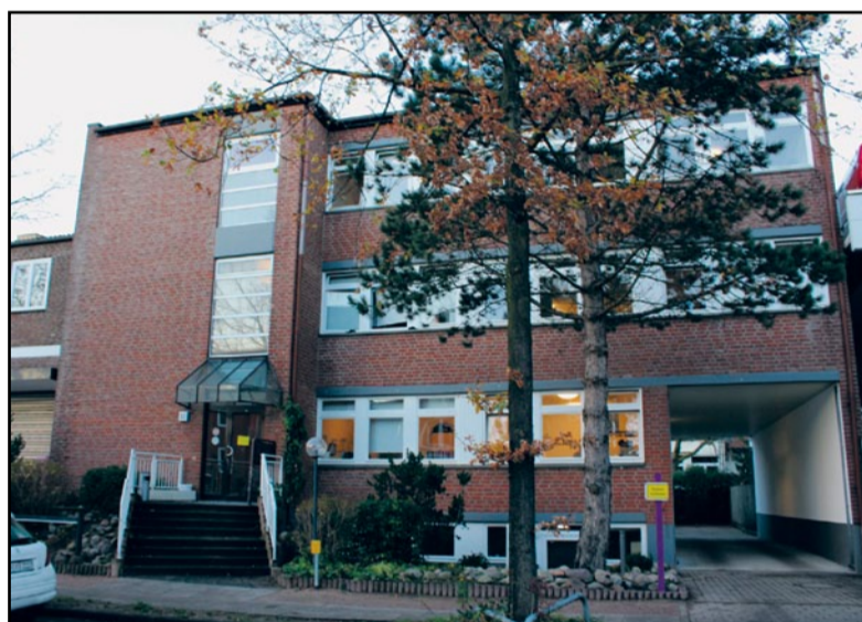
Die Erstversorgung 13 in der Straße Bötelkamp in Eimsbüttel wurde im November 2015 in Betrieb genommen. Die Einrichtung bietet 32 Plätze für unbegleitete minderjährige Flüchtlinge.

Flüchtlinge im LEB in 14 Monaten um mehr als 500 Prozent erhöht! LEB-Geschäftsführer Klaus-Dieter Müller über ein mehr als herausforderndes Jahr.