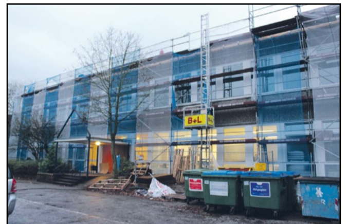
Mit 36 Plätzen konnte im Oktober die Erstversorgung 15 auf dem Gelände der Schule Kielkoppelstraße ans Netz gehen. Nach dem Umbau der zweiten Etage stehen hier 80 Plätze zur Verfügung.