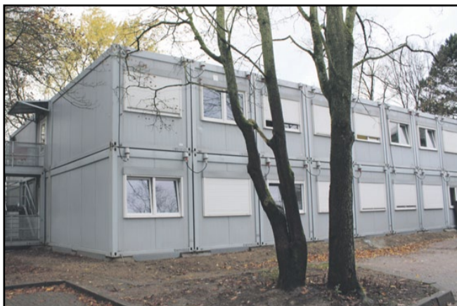
Speziell Mädchen und junge Frauen werden in der Erstversorgung Hohe Liedt aufgenommen. 30 Plätze bieten die Container seit Herbst für die Betreuung dieser Zielgruppe.