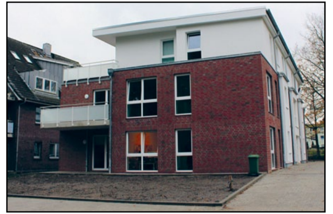
In der Straße Kathenkoppel im Stadtteil Farmsen wurde im Oktober mit dem Angebot Ambulant betreutes Wohnen mit 23 Plätzen eine Folgeeinrichtung für junge Flüchtlinge eröffnet.