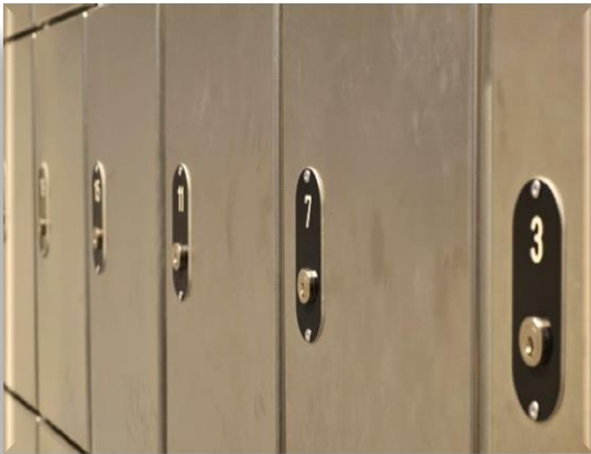
Die Schließfachnummer entspricht ...

Es ist untersagt, Gegenstände, Geld (außer das zugelassene Münzgeld) oder Alkohol/ Drogen in die Anstalt einzubringen und beim Besuch an den Gefangenen zu übergeben. Sie dürfen keine Gegenstände, z.B. Briefe der Insassen, vom Besuch mit aus der Anstalt nehmen.