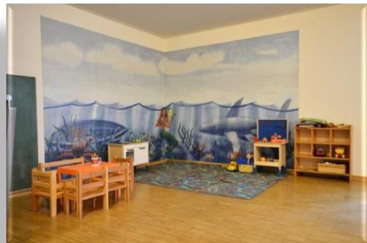
Spielecke für Kinder