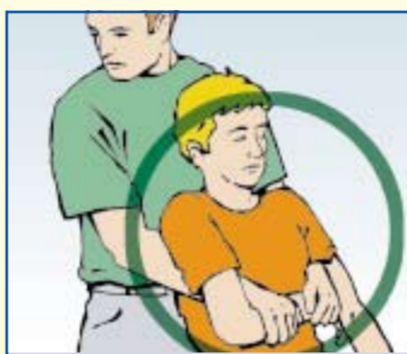
Person ggf. aus dem Gefahrbereich retten