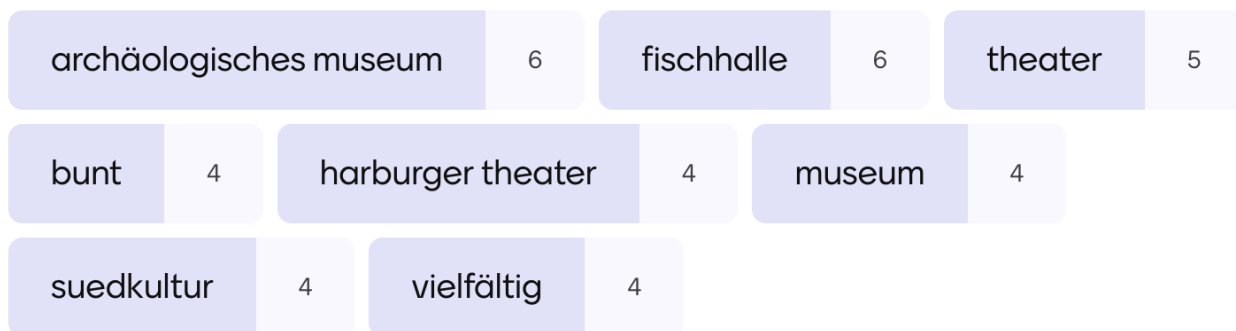
Abb.: Was macht Sie glücklich, wenn Sie an Kunst und Kultur in Harburg denken? (die häufigsten Antworten) (N=92, Antworten=372).