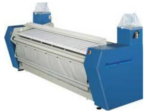
Die Eingabemaschine CEM –ST 30

Seit Inbetriebnahme zum Herbst 2008 werden folgende Energie und Betriebskosteneinsparungen erzielt.