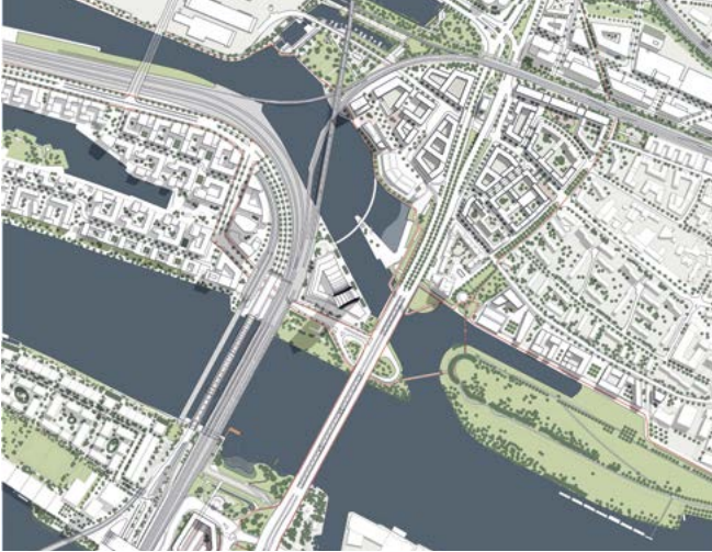
Übersichtsplan mit Teilräumen

über die Elbe schon heute eine Veloroute, aber die Radspuren sind beengt und müssen aufgewertet werden. Für die Vernetzung innerhalb der Stadtteile sind auch die neuen Freizeitwege wichtig – etwa im Billepark oder zwischen der Veddel und dem Grasbrook. Es gilt also, das Tor zur inneren Stadt zu inszenieren, aber eben auch Stadtteile lebenswert weiterzuentwickeln. Dazu haben wir eine Unterteilung in drei Teilbereiche vorgenommen.