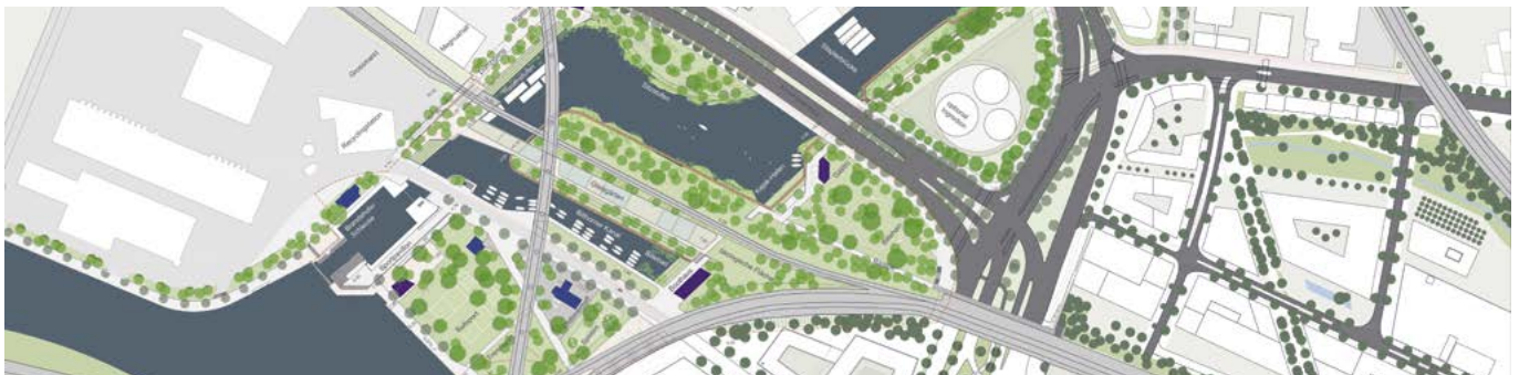
Billepark langfristige Planung

Längerfristig gibt es mehrere Möglichkeiten. Am Westufer der Bille könnte eine Promenade entstehen und die Brücke, die heute noch für Logistik genutzt wird, könnte zu einem Gleisgarten umgewandelt werden. So kann langfristig nach und nach eine zusammenhängende Parklandschaft entstehen.