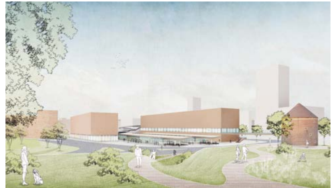
Variante B Blick auf den Markt

Die Zollhallen selbst sollen durch kleinteilige gewerbliche Nutzung belebt werden.