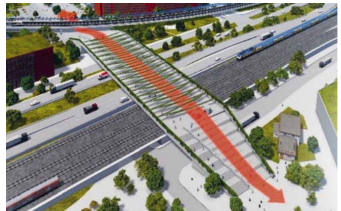
Geplante Brücke zwischen Veddel und Grasbrook

Für die nörliche Veddel geht es einerseits um die Verbindung mit der anderen Elbseite, also dem südlichen Rothenburgsort, dem Billebogen und der östlichen HafenCity und andererseits um die Verbindung mit dem künftigen neuen Nachbarstadtteil Grasbrook. Im Grunde gilt dies für die Veddel insgesamt. Meiner Meinung nach sollten wir die Ambitionen insgesamt hochhängen und sagen: Das wird ein Doppelstadtteil Veddel-Grasbrook!