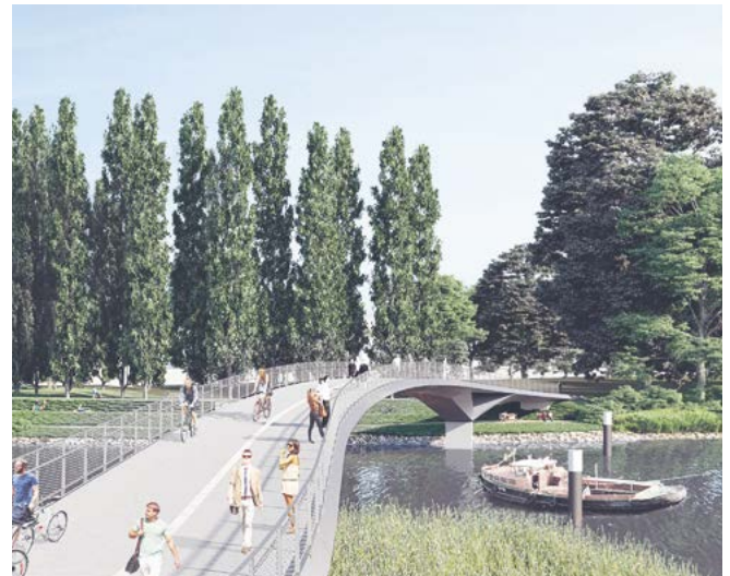
Entwurf zur neuen Brücke Entenwerder

Zu guter Letzt: Es gibt nicht nur schöne Pläne, sondern auch schon etwas Konkretes, das ich Ihnen zeigen möchte: Heute Morgen haben wir in einer Pressekonferenz den Entwurf für eine neue Fußgänger- und Fahrradbrücke von der HafenCity nach Rothenburgsort zum Entenwerder Park vorgestellt. Daran sieht man: Es geht in diesem Stadtraum eben nicht nur ums Bauen, sondern vor allem ums Verbinden.