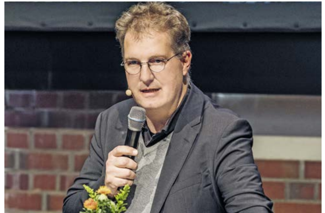
Franz-Josef Höing, Oberbaudirektor der Freien und Hansestadt Hamburg

Es gibt an den Elbbrücken einige Orte mit einer eigenen Schönheit, die nicht geplant war, beeindruckende Infrastrukturen, die sich mit dem Wasser treffen und unglaubliche Panoramen. Auch der Verkehrslärm ist dort natürlich immens. Es ist nicht so, dass wir mit