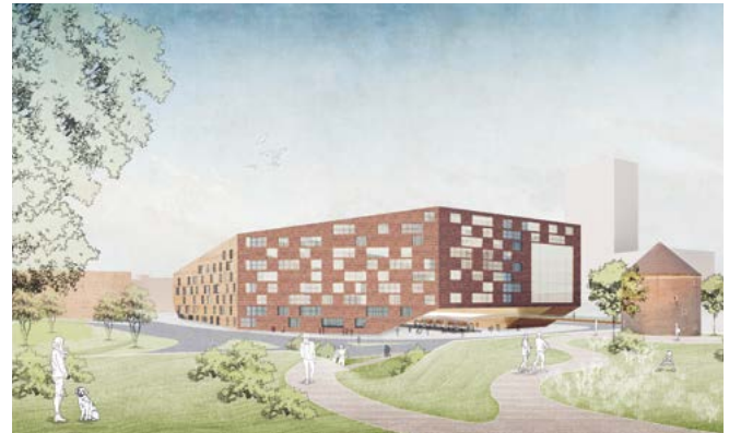
Variante A Superblock

Für die Bebauung werden zwei Varianten vorgeschlagen: „Die Veddel weiterbauen“ lautet der Ansatz aus dem Testplanungsverfahren. Rund um die Zollhallen entsteht ein großer Wohnblock, der durch einen großen Innenhof auch lärmgeschütztes Wohnen ermöglicht. Dieser Ansatz nimmt die DNA der Veddel auf. Die typische Blockstruktur wird fortgesetzt und an die Elbe herangeführt. Der neue Superblock wird im Erdgeschoss „durchwegt“. Von der Veddel kommend können Fußgänger über eine Brücke zum Deichpark gelangen. In dieser Variante ist es schwieriger, die Zollstation in ihrer vollständigen Länge zu erhalten.