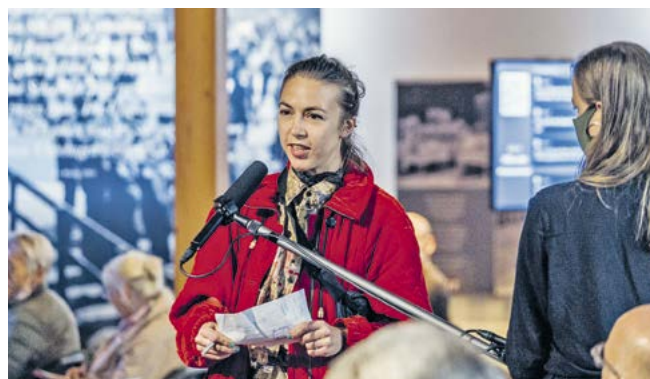
Bewohnerin der Veddel