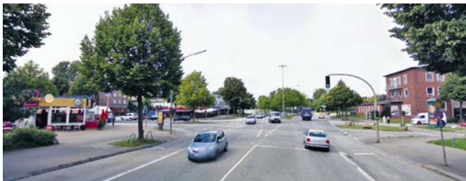
Billhorner Röhrendamm heute (li) und Stadtplatz am Röhrendamm (re)