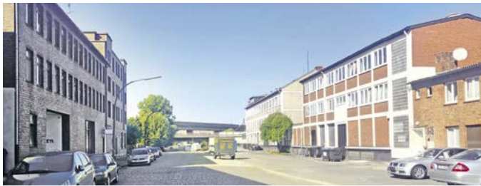
Brandshof heute (li) und nach Umgestaltung (re)