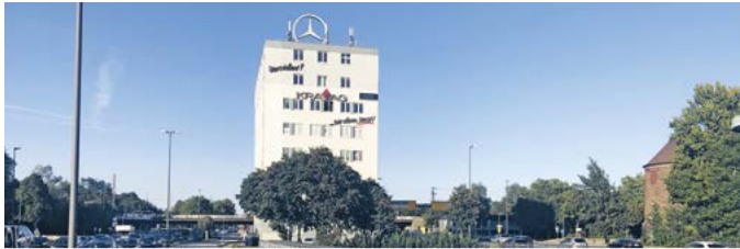
Querung an der Billhorner Brückenstraße heute (li) und nach Umbau (re)