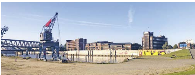
Blick in den Billhafen (li) und künftige Silhouette (re)