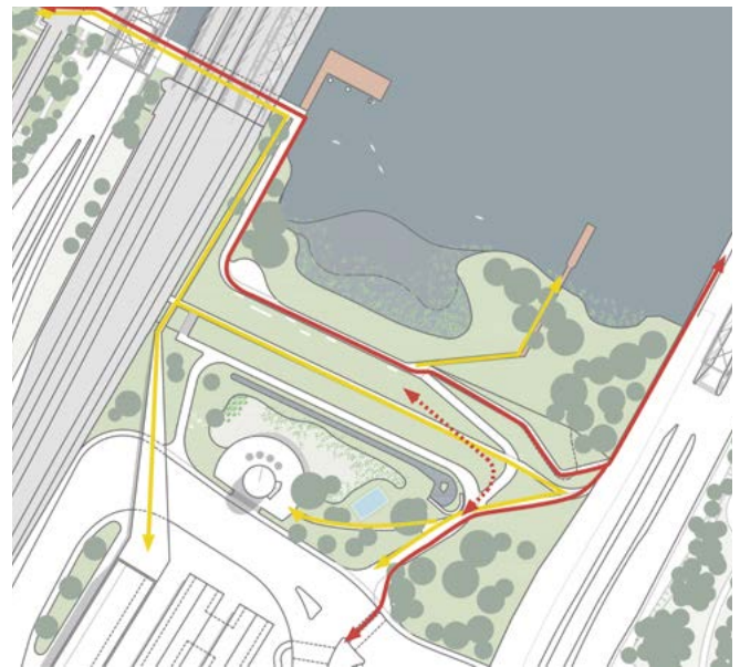
Veddeler Balkon Wegeverbindungen

Um solche Orte nutzbar zu machen und mit Leben zu füllen, ist ein eng geknüpftes Wegenetz unabdingbar. Das betrifft die übergeordneten Fuß- und Radwege von Rothenburgsort kommend zur Veddel, aber auch den neuen Stadtteil Grasbrook, der durch eine neue Unterführung unter den Elbbrücken erreicht wird. Zusätzliche Freizeitwege gewährleisten die Erlebbarkeit dieses Areals. Das Wegenetz soll natürlich barrierefrei werden.