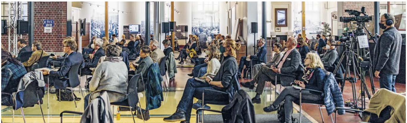
Mit ausreichend Abstand voneinander verfolgen die Live-Gäste im Auswanderermuseum die Präsentation der Planer