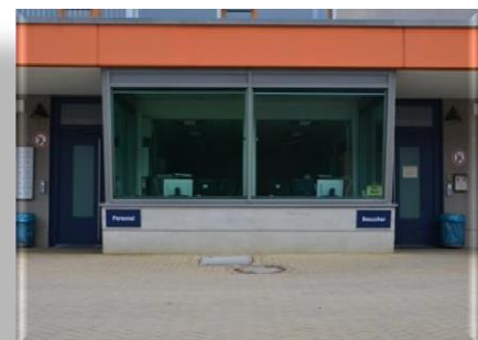
Besuchereingang auf der rechten Seite

Den genauen Besuchstermin Ihres Besuches erfahren Sie bei der Terminabsprache.