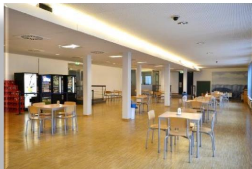
Besucherraum mit Snack- und Getränkeautomaten

Die JVA Billwerder verfügt über ein eigenes Besuchszentrum. Der Zugang ist barrierefrei eingerichtet.