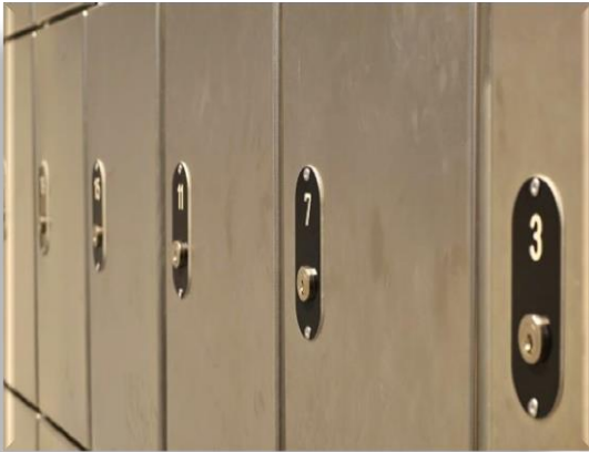
Die Schließfachnummer entspricht ...

Es ist untersagt, Gegenstände, Geld (außer das zugelassene Münzgeld) oder Alkohol/ Drogen in die Anstalt einzubringen und beim Besuch an den Gefangenen zu übergeben. Sie dürfen keine Gegenstände, z.B. Briefe der Insassen, vom Besuch mit aus der Anstalt nehmen.