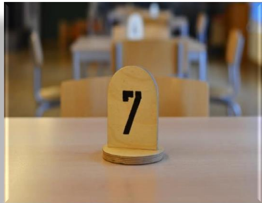
... Ihrer Tischnummer im Besucherraum.

Die vorgegebene Sitzordnung ist einzuhalten. Bitte achten Sie darauf, dass Ihre Kinder am Tisch bleiben.