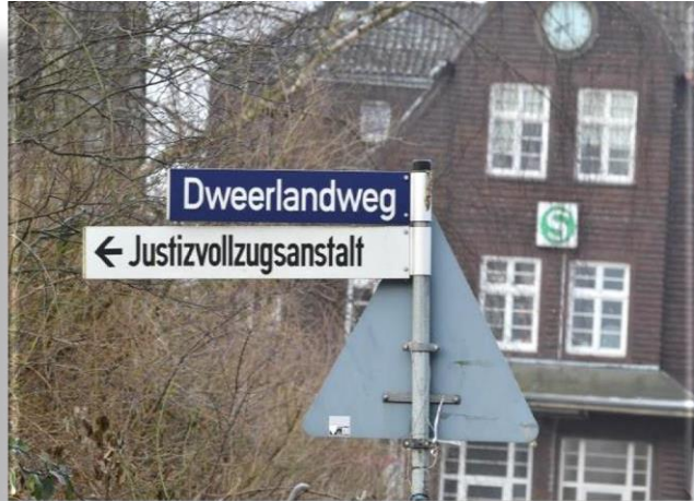
Hinweisschilder zur JVA am S-Bahnhof Billwerder-Moorfleet

Sie erreichen uns am besten mit dem PKW . Ausreichend Parkplätze stehen Ihnen direkt am Anstaltsgelände zur Verfügung. Alternativ erreichen Sie uns mit der S21 Haltestelle Billwerder-Moorfleet . Von dort folgen Sie der Beschilderung ca. 1500m zur JVA Billwerder.