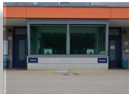
Besuchereingang auf der rechten Seite

Den genauen Termin Ihres Besuches erfahren Sie bei der Terminabsprache.