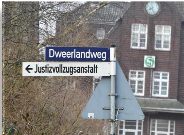
Hinweisschilder zur JVA am S-Bahnhof Billwerder-Moorfleet

Sie erreichen uns am besten mit dem PKW . Ausreichend Parkplätze stehen Ihnen direkt am Anstaltsgelände zur Verfügung. Alternativ erreichen Sie uns mit der S21 Haltestelle Billwerder-Moorfleet . Von dort folgen Sie der Beschilderung ca. 1500m zur JVA Billwerder.