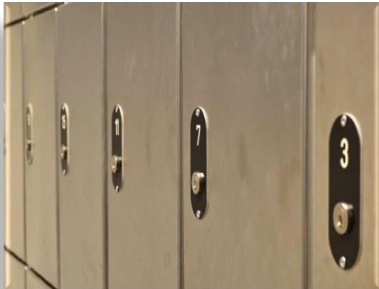
Die Schließfachnummer entspricht ...

Es ist untersagt, Gegenstände, Geld (außer das zugelassene Münzgeld) oder Alkohol/ Drogen in die Anstalt einzubringen und beim Besuch an den Gefangenen zu übergeben. Sie dürfen keine Gegenstände, z.B. Briefe der Insassen, vom Besuch mit aus der Anstalt nehmen.