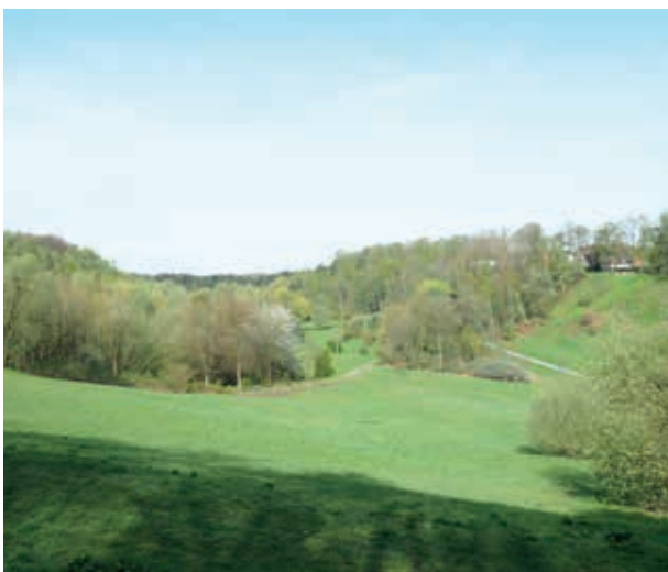
Rissener Sandkuhle, ein großzügiges Freizeit- und Sportgelände