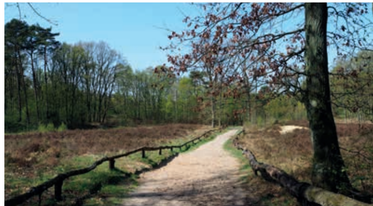
Auf sandigen Wegen durch die Wittenberger Heide

Verbindungsroute Wittenbergener Heide – Regionalpark Wedeler Au – Route S-Bahn-Trasse auf der Brücke queren, rechts Hinter der Bahn und folgende Straßen entlang der S-Bahn, dem Grünzug entlang der S-Bahn folgen, → Sieversstücken, Wüstland, Hempbarg, Sülldorfer Mühlenweg, Wittland zum S-Bahnhof Sülldorf.