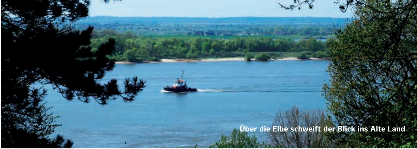
Über die Elbe schweift der Blick ins Alte Land