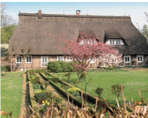
Zugangsbereich zum Botanischen Garten Kulturzentrum Heidbarghof mit Bauerngarten