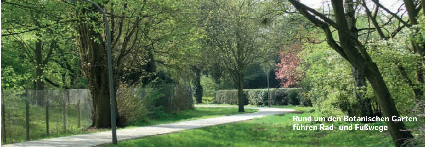
Rund um den Botanischen Garten führen Rad- und Fußwege