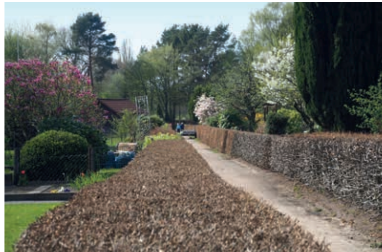
Frühling im Kleingartenverein Veermoor 211

Vom Vorhornweg über Hellgrundweg, Stadionstraße Richtung Tutenberg.