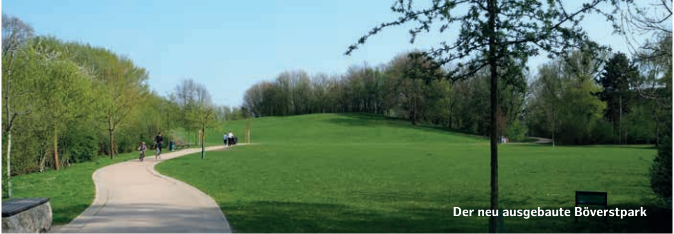
Der neu ausgebaute Böverspark