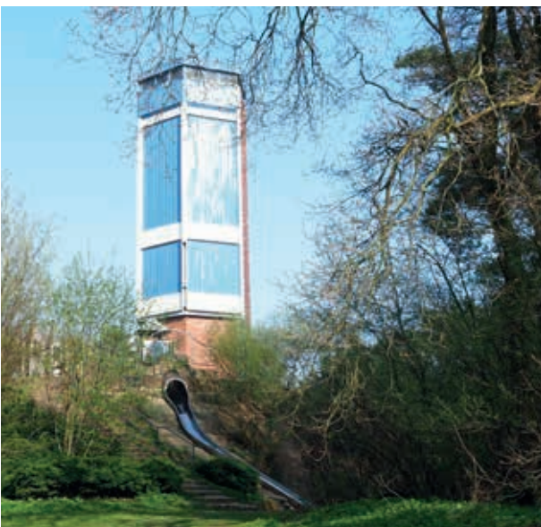
Klettern am DESY Turm