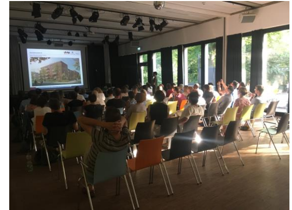
Informationsveranstaltung Ausschreibung Dieselstraße

Bei geförderten Projekten: Übermittlung der endgültig hergestellten Geschossfläche und der Stockwerksliste (Belegung der geförderten Wohnungen).