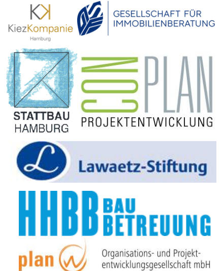
Logos einiger Baubetreuungsbüros in Hamburg