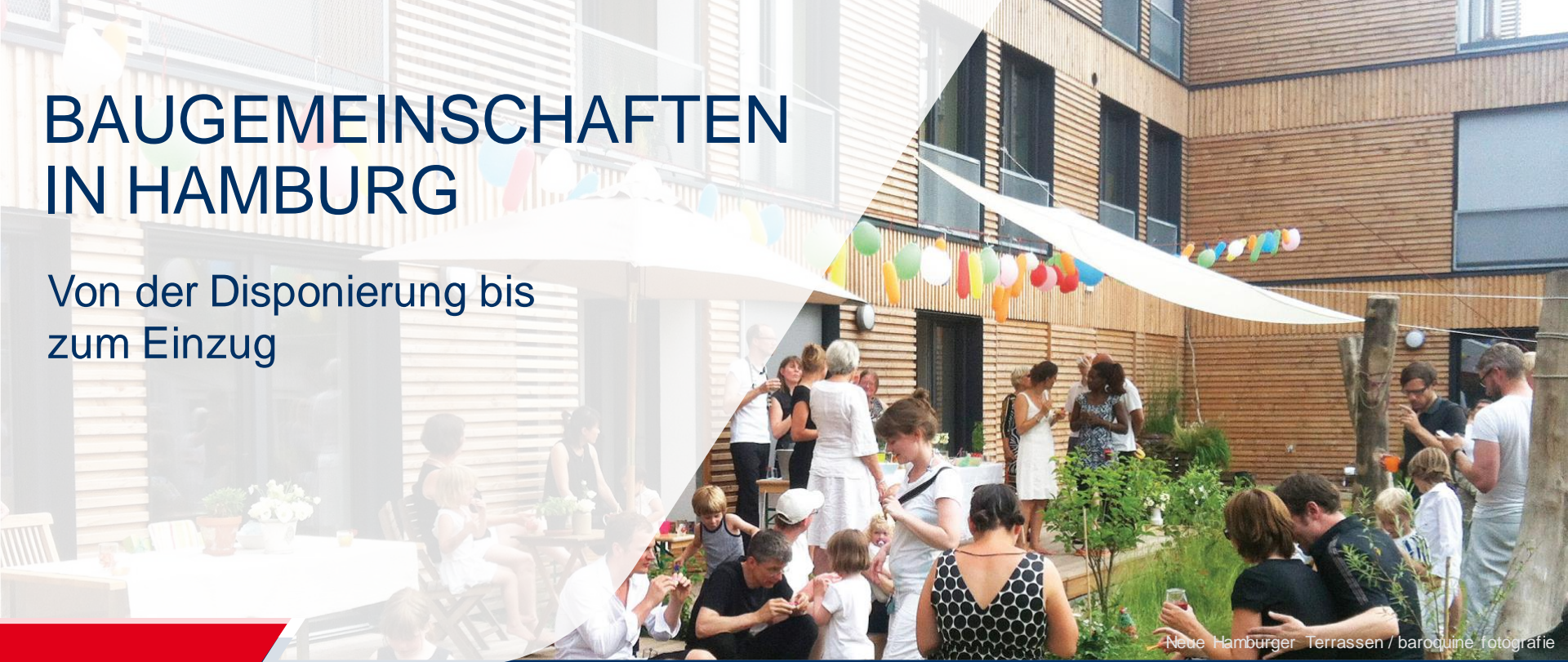
Neue Hamburger Terrassen

27.08.2024 | Kontaktbörse „Baut zusammen!“